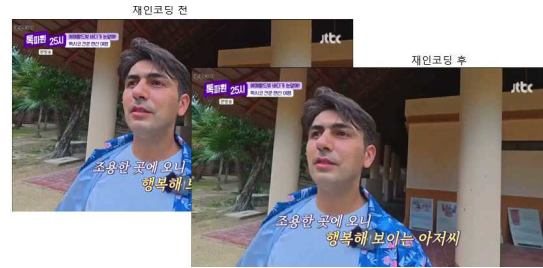
그림 6. 다중 재인코딩에 의한 변형 예시 Fig. 6. Example of transformation caused by multiple re-encoding

다중 재인코딩은 영상이 반복적으로 압축 및 변환되면서 품질이 저하되는 경우이다. 다중 재인코딩에 의한 변형 예시는 그림 6과 같다.