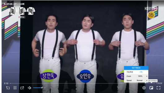
그림 4. 화면녹화에 의한 변형 예시 Fig. 4. Example of transformation caused by screen recording

재촬영은 모니터, TV, 모바일 화면 등을 외부 기기로 다시 촬영하는 방식이다. 재촬영에 의한 변형 예시는 그림 5와 같다.