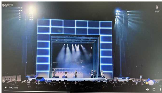
그림 5. 재촬영에 의한 변형 예시 Fig. 5. Example of transformation caused by camera re-recording

재촬영은 모니터, TV, 모바일 화면 등을 외부 기기로 다시 촬영하는 방식이다. 재촬영에 의한 변형 예시는 그림 5와 같다.