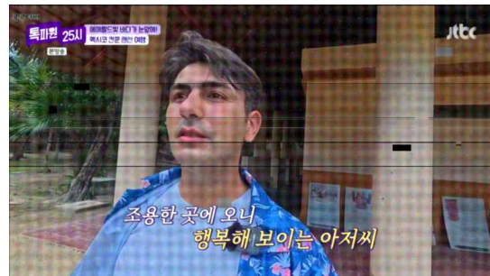
그림 7. 화질 열화 예시 Fig. 7. Example of video quality degradation

불법 스트리밍 영상은 반복적인 압축, 재생, 녹화, 재전송 과정을 거치면서 전반적인 화질 열화가 발생할 수 있다[7,9,10]. 원본 대비 세부 정보가 손실되거나 화면 내 노이즈가 증가한 화질 열화 예시는 그림 7과 같다.