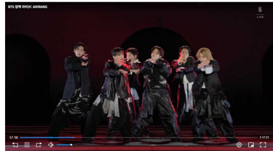
그림 1. 플레이어 UI 노출 예시 Fig. 1. Example of player UI exposure

플레이어 UI는 재생 바, 일시정지 표시, 볼륨 조절, 설정 아이콘 등으로 구성될 수 있으며, 주로 화면 하단이나 가장자리에 표시된다. 이러한 요소는 원본 영상에는 존재하지 않지만 실제 탐지 대상 영상에는 포함될 수 있으므로, 영상의 일부 영역을 가리거나 특징 추출 과정에서 잡음으로 작용할 수 있다[9,10,13].