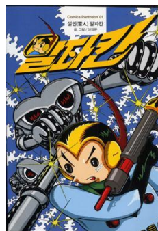
<그림 3> 복간된 『설인 알파칸』 표지

주지하다시피, 『서유기』가 한국에서 처음 만화로 만들어진 것은 1965년 11월 『새소년』이라는 만화잡지에 실린 『설인 알파칸』이다. 이는 『서유기』를 현대적으로 해석한 공상과학 만화로서 원천텍스트와는 어느 정도 거리감이 있다. 『설인 알파칸』에는 『서유기』의 주인공들이 전부 등장하지 않음은 물론, 주인공인 알파칸 조차 손오공이 본디 지니고 있는 특징을 보이지 않고 있다. 즉 작가 임의대로 재창조한 것이라 할 수 있다. 이러한 점에도 불구하고 『설인 알파칸』은 한국에서 최초로 『서유기』를 만화 콘텐츠로 변용한 작품이라는 사실만으로도 큰 의미를 지니고 있다고 할 수 있다. 여기서 흥미로운 사실은 최근 청강문화산업대학 부설 만화역사박물관이 60년대 SF 만화를 복원하여 출간하면서 『설인 알파칸』도 함께 복간하였으며, 이미 많은 사람들이 이를 소장하기 원했다는 점이다.