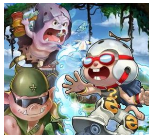
<그림 5> 《날아라, 슈퍼보드》의 손오공, 사오정, 저팔계 캐릭터

인물들을 형상화 하였으나, 《날아라, 슈퍼보드》의 캐릭터만큼 대중의 사랑을 받지 못했다. 그렇다면 한국에서 《날아라, 슈퍼보드》의 캐릭터들이 유독 사랑을 받는 이유는 무엇일까? 이를 수용미학적인 관점에서 접근해보면 매우 흥미로운 사실을 발견할 수 있다. 일반적으로 수용 미학적 관점에서 작품의 심미적 가치를 결정하는 중요한 평가기준 중에는 ‘기대지평(horizon of expectation) 24) ’이