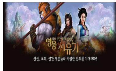
<그림 6> 《영웅 서유기》 웹게임 광고

또한 최근 들어, 『서유기』의 캐릭터 콘텐츠로서의 확장은 게임 캐릭터로까지 발전되는 양상을 보인다. 앞에서 언급했다시피, 《날아라, 슈퍼보드》 이후 『서유기』에 대한 애니메이션적 변용은 사실 거의 이루어지고 있지 않다. 때문에 만화나 애니메이션을 통해 형