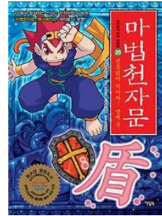
<그림 2> 『마법천자문』표지

기』변용의 가장 대표적인 사례라 할 수 있다. 특히 2009년 『소년한국일보』는 『마법천자문』을 ‘우수 어린이 도서’로 선정하였으며, 『마법천자문』의 높은 학습 효율성과 한자 능력 검정 시험 대비서로서의 실용성에 대해 긍정적으로 평가하였다. 또한 『서유기』를 원천소스로 하였고, 서유기에 등장하는 인물들의 활동을 통해 한자를 익힌다는 점에서 ‘기발한 발상’이라는 평을 내놓았다.