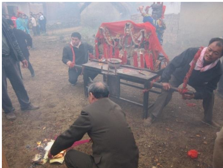
圖7 在香火堂前遣災，山尾村，2011年