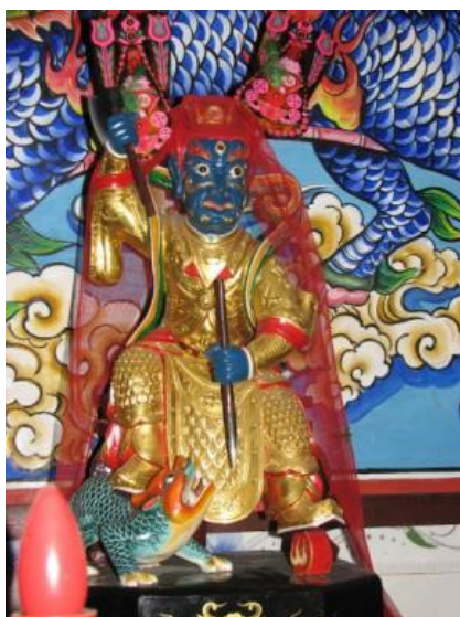
圖5 雷首像, 东角村