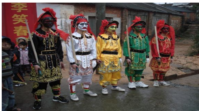
圖2 榜山村扮演五雷公將的孩子，2012年