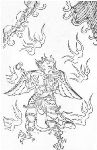
圖6 《三教源流搜神大全》里的雷部元帅辛兴苟像