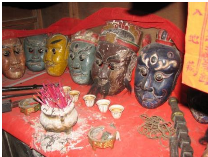
圖4 唐陶村 面具