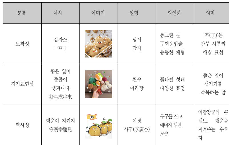
〈표 1〉 간쑤성 음식캐릭터의 모에 요소 특징

감자만 있으면 된다(五穀不收不憂患,只要有兩畝洋芋蛋)’와 같은 표현이 존재하며, ‘감자는 밥상의 보배, 하루 세 끼 빠질 수 없다(洋芋蛋寶中寶,頓頓吃飯離不了)’, ‘그릇에 담고, 솥에 끓이고, 밭에서 키우고, 평소에도 생각난다(碗裏端着,鍋裏煮着,地裏長着,平常想着)’와 같은 속담으로도 반영되었다. 13) 나아가 간쑤의 문화는 감자를 심고, 먹고, 파는 사람들이 감자를 위해 살고, 감자를 위해 죽는 문화 그 자체다라고 서술하였다. 14) 이처럼 감자와 지역 정체성 간의 밀접한 관계는 지역 문화콘텐츠로 확장되었으며, 당시는 ‘감자 문화 축제’를 통해 감자 음식 문화를 대중화하고, ‘당벤 감자’ 브랜드로 부가가치를 높여 농민 생활 향상에도 기여하였다.