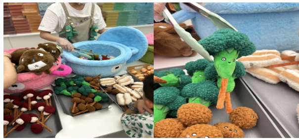
<그림 1> 마라탕 인형 조리 장면

심으로 유기적으로 상호작용하며, 몰입적 소비 경험의 기반을 형성하게 된다. 결국 문화는 ‘몸으로 겪는 것’이 되었으며, 소비자는 감각을 통해 문화를 체험하고, 신체를 매개로 문화적 의미를 해석하게 된다.