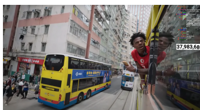
图 4. 甲亢哥在香港公交车上