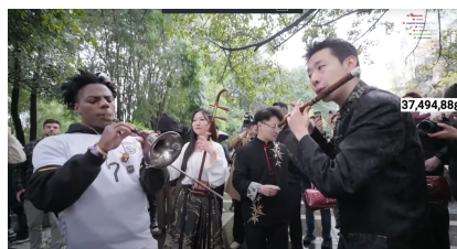
图 3. 甲亢哥在成都一公园与一支民乐队互动