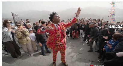
图 2. 甲亢哥在长城表演后空翻