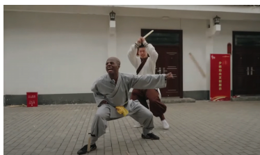
图 6. 甲亢哥在少林寺戏仿武僧拜师学艺

甚至带有冒犯。甲亢哥在直播中不断制造这种“插科打诨式”场面——在少林寺戏仿拜师，被僧人棍击后的滑稽反应与黑人身份的视觉反差制造了极强的喜剧效果（图6）；在故宫穿花衣、做夸张表情，打破了传统空间的庄严气氛；在深圳船上高喊“同志们好”，以“社会主义问候”化解文化隔阂。这些戏仿动作不仅让观众捧腹，也在笑中实现了文化互释（图7）。笑的力量在此成为跨文化的“软性翻译”，既消解差异，又制造认同。