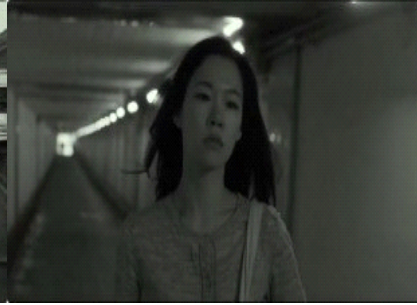
图 4. 中近景下艺璃游荡式的行走在街道中的场面

影片中多次出现的空镜头也进一步强化了这种伦理在场的结构。空镜头并不承担情节推进功能，而是在人物离开之后，继续停留于空间之中，城市中过往的地铁、静止的街道、高压电线区域。这些画面并非叙事间隙，而是对人物伦理行动的延伸与回响。正是在人物暂时缺席的画面中，伦理关系并未消失，反而以“留白”的形式持续存在。空镜头保留的时间，使伦理身份从个体行动延伸为空间中的关系状态。沉默、空镜头与不同景别的组合，使伦理不以判断结果出现，而以持续被观看、被感知的关系状态存在。人物是否停留、是否离开、是否继续承担，构成了影像中最为重要的伦理判断依据。在这一意义上，伦理身份并不是被叙事确认的结果，而是在镜头所构建的时间与空间之中，被不断生成与维持的存在。