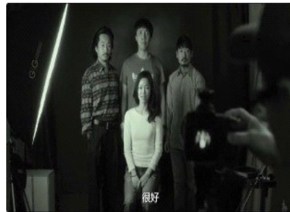
图 11. 四人拍照的位置关系