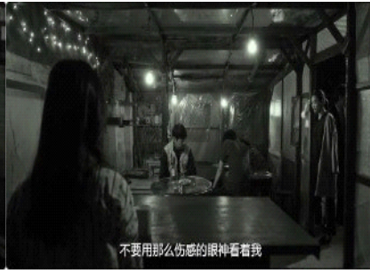
图 16. 酒馆内的人物的位置关系画面