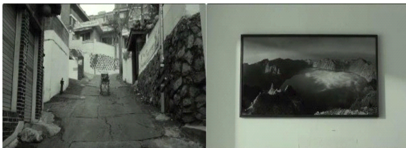
图 7. 艺璃做梦时父亲的轮椅从坡上滑下的空镜头

轮椅空镜头以艺璃生活场域中的坡路为载体，将父亲行动依附的工具转化为其照料责任的具象符号。无人推动却沿坡下滑的轮椅，隐喻艺璃对责任失控和亲缘关系脱离的潜在焦虑。与之相对，艺璃家中墙面的长白山天池画像，则成为其身份双重性的视觉锚点。作为朝鲜民族地域与文化认同的象征，它被置于艺璃简朴、边缘的生活空间中，形成宏大文化符号与现实生存处境之间的反差。