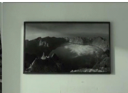
图 8. 艺璃家挂着长白山天池画像的空镜头