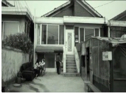
图 3. 全景镜头下人物的身份关系