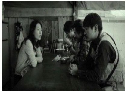
图 9. 四人谈话时的位置关系

人物的伦理位置并非由身份标签或情感宣言决定，而是通过画面中的空间关系被不断标示。艺璃在黑白影像中，始终处于关系网络的中心位置，无论是在酒屋的聚会场景，还是在照料父亲的私密空间中，她都并非通过言说确立自身存在，而是在空间中被他者围绕、被关系需要，从而成为伦理关系得以运转的核心节点。