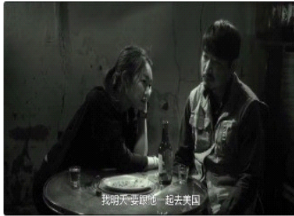
图 15. 庭凡前女友来到酒馆挽留庭凡的画面