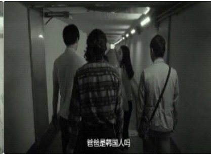
图 10. 四人在地下隧道内的位置关系