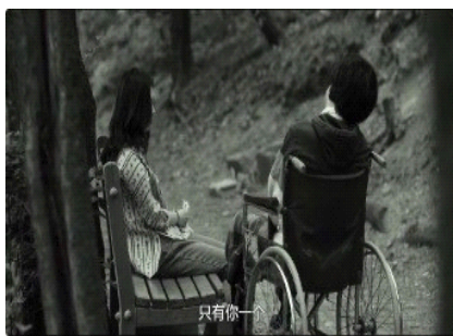
图 14. 艺璃与父亲在树林中谈话的场面

艺璃与父亲的伦理关系，并非以稳定的亲情纽带或明确的责任宣言呈现，而是在一次几乎被中断的关系瞬间中，通过影像完成其伦理身份的重新确认。伦理包含两个内在的准则，即互助伦理 (Ethique de solidarite) 和责任伦理 (Ethique de la responsabilite)”。 34) 很明显，艺璃与父亲的伦理准则更符合后者。影片中，艺璃曾一度向父亲坦露过想要抛弃他的念头，这一言语并未被导演处理为戏剧性的道德冲突，而是被迅速收束进一个由停顿、沉默与空间构图所构成的伦理场面之中。当父亲在轮椅上缓慢而艰难地说出“只有你一个女儿”这句话时，影片并未通过近距离的情感特写或音乐强化来引导观众的同情，而是以克制的构图与延宕的时间处理，使这一伦理唤认在画面中缓慢生效。艺璃的身体在此刻发生了明显的停顿。她并未立刻回应，也未转身离开，而是在父亲与自己之间形成了一段被拉长的沉默。这一停顿并非心理犹豫的简单再现，而是伦理身份被重新安置的瞬间。在这一场面中，人物借助画面中时间的延宕与身体姿态的变化，使伦理身份以影像的方式被看见。艺璃是否会抛弃父亲，并不是一个由意志决定的结果，而是在父亲的言语唤认与画面停顿所构成的伦理现场中，被重新安置的位置。正是在这一刻，伦理身份不再是可以协商或逃离的选择，而成为一种无法被忽视的存在状态。