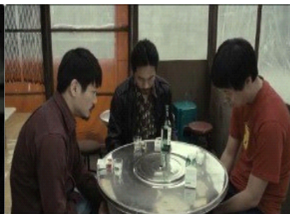
图 13. 缺少了艺璃画面变为彩色