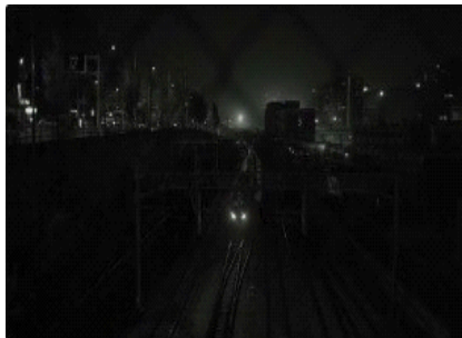
图 5. 夜幕下地铁的空镜头

影片中多次出现的空镜头也进一步强化了这种伦理在场的结构。空镜头并不承担情节推进功能，而是在人物离开之后，继续停留于空间之中，城市中过往的地铁、静止的街道、高压电线区域。这些画面并非叙事间隙，而是对人物伦理行动的延伸与回响。正是在人物暂时缺席的画面中，伦理关系并未消失，反而以“留白”的形式持续存在。空镜头保留的时间，使伦理身份从个体行动延伸为空间中的关系状态。沉默、空镜头与不同景别的组合，使伦理不以判断结果出现，而以持续被观看、被感知的关系状态存在。人物是否停留、是否离开、是否继续承担，构成了影像中最为重要的伦理判断依据。在这一意义上，伦理身份并不是被叙事确认的结果，而是在镜头所构建的时间与空间之中，被不断生成与维持的存在。