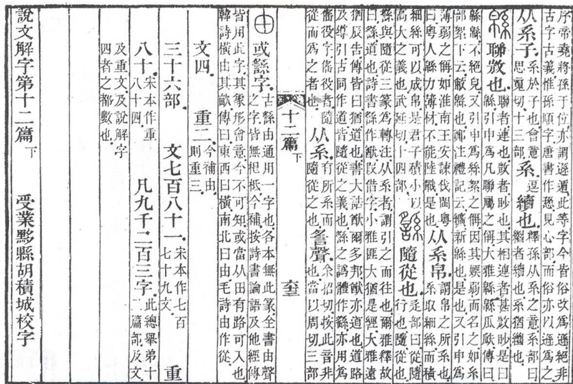
그림 1. 「說文解字(설문해자)」에 나오는 고대의 “縣”