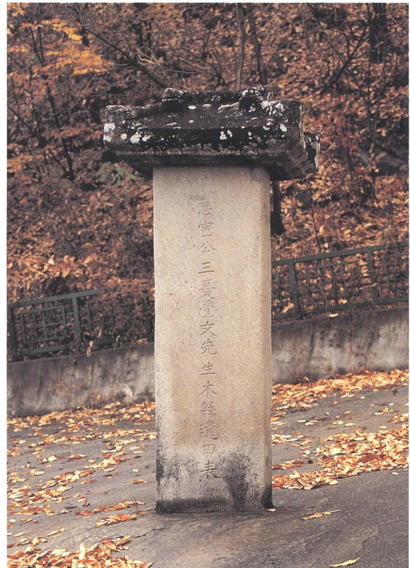
그림 4. 忠宣公三憂堂文益漸木縣遺田表

우리나라에 목면이 들어온 것은, 고려 말(1363)에 「문익점(文益漸)선생께서 "원(元)나라"(현재의 China)에서 귀국하시면서 "붓 대롱" 속에 목화(木花) 씨앗을 감추어 가져와 목화재배를 처음 시작했다.」라고 하는 이야기는 누구나가 다 알고 있지만, 어느 곳에서 처음으로 목화재배에 성공했지는 잘 알려져 있지 않습니다.