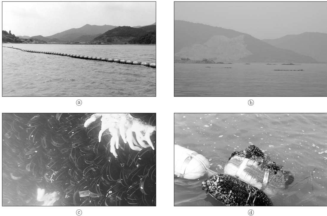
Fig. 3. Examples of silt protector in the south coast of Korea