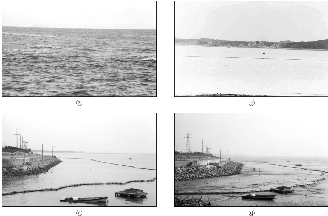
Fig. 1. Examples of silt protector in the west coast of Korea