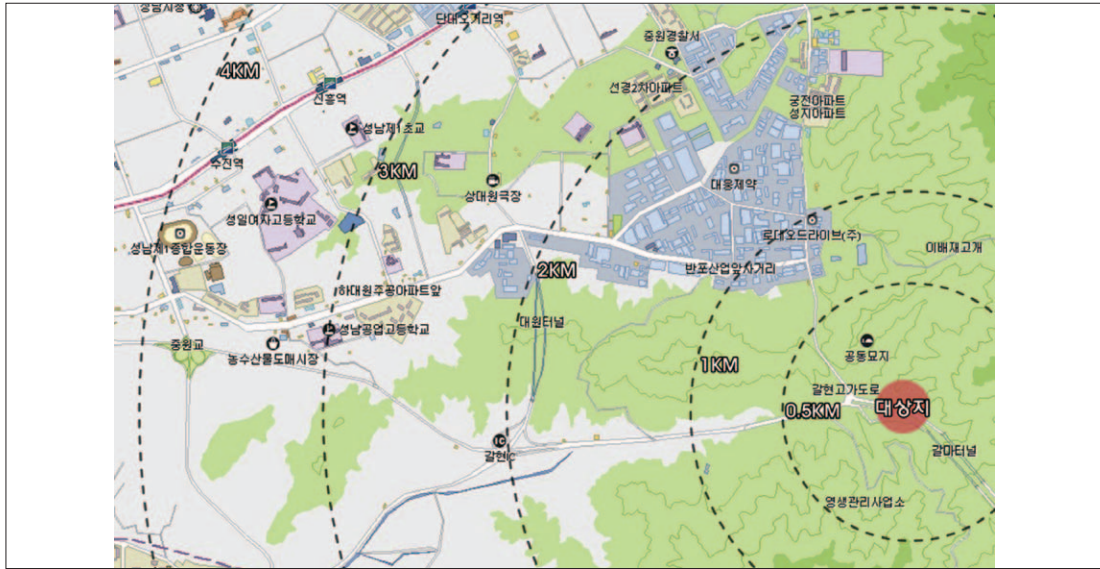
그림 1. 연구대상지역의 지리적 위치