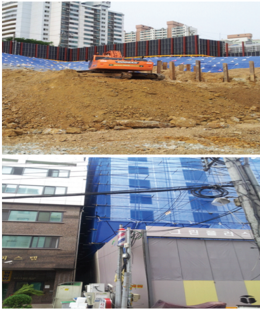
Figure 2. Position of noise barrier and receiver in city construction sites

수족 만족하지 못하는 경우가 있어 소음이 우려되는 고층을 수음점으로 정하여 환경목표기준을 만족할 수 있도록 하여야 한다.