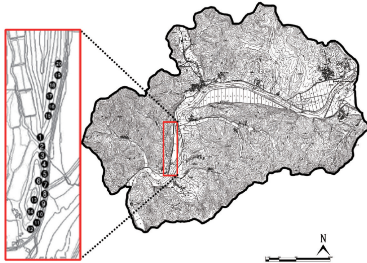
Figure 2. The survey plots and site of this study

초본층은 Braun-Blanquet(1964)의 우점도와 군도 계급을 사용하였다.