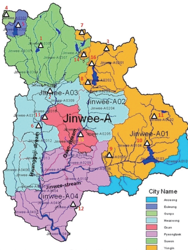
Figure 1. Jinwee-stream watershed map and public sewage treatment works(△)

먼저 방류수 수질 준수농도(안)를 도출하기 위해 진위천수계 내 공공하수처리시설을 대상으로 정하였고, 이들 강화된 방류수 수질 준수농도(안)를 입력 데이터로 하여 진위천수계를 연구 대상지역으로 선정하여 수질예측모델링을 수행하였다. 이는 진위천수계 상위 단위유역인 안성천유역에 대해 가장 최근인 2014년 유역하수도정비계획을 수립하였고, 또 2009