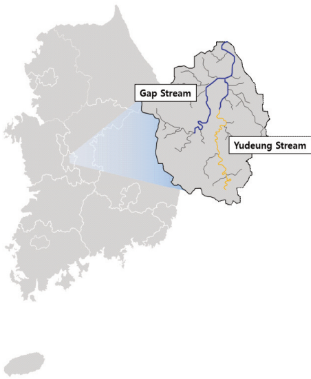
Figure 1. Location Map of Test Stream studied

평가단위를 체계화하였고, 따라서 지구 지정의 기본 단위는 하천 세구간과 하천 아세구간이다.