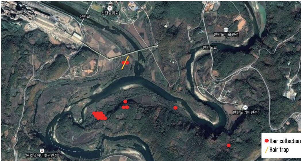
Figure 2. Location of hair trap and collection of hairs identified as wild boar species.