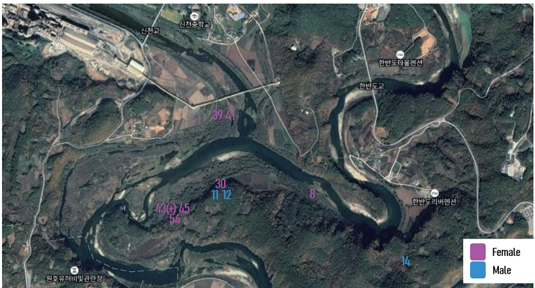
Figure 3. Locations where samples from different individuals were collected. Number represents the sample number except '43(+)' which represents samples of 43, 44, 55, 58, 59, and 60.