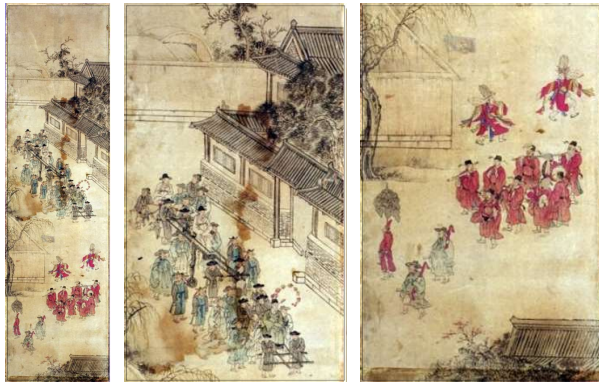
<그림 3> 《평생도》의 <회방례>, 국립중앙박물관 소장. <회방례> 전도(좌), 가마 행렬 부분(중), 악사와 광대 부분(우)