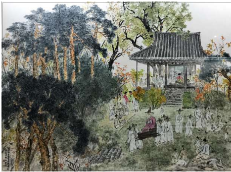
<그림 2> 송순의 과거급제 60년 잔치를 묘사한 《면양정 회방연도》(금봉 박행보 그림, 한국가사문학관 소장, 2000년 제작)