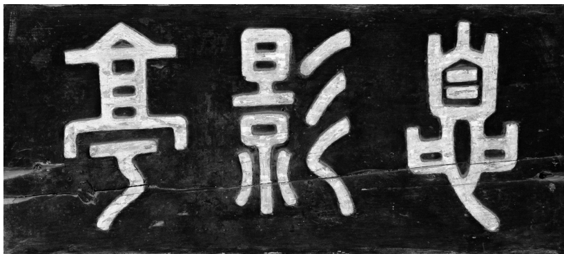
그림 3 식영정 현재 현판