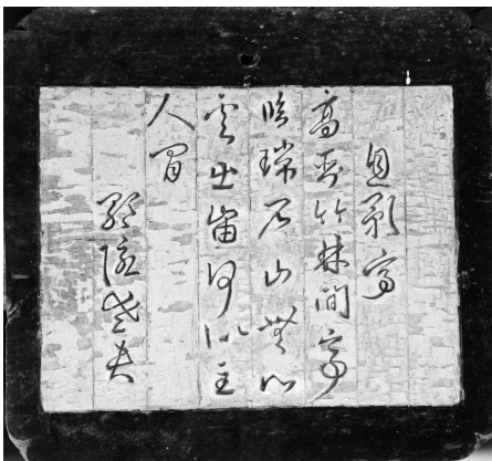
그림 5 식영정 현판, 歌隱老夫 作

이곳에서 사는 즐거움을 노래하며 자유자재한 생활모습을 보여주고 있다. <식영정20영>은 식영정에서 바라본 경관을 장소에 따른 특성을 간추려서 노래한 작품이다. 곧 식영정정 주변의 산, 마을, 시냇물, 숲, 들판의 모습을 구체적으로 묘사하면서 자연과 함께 하나가 되고자 하는 이상향을 공간의 인식 태도를 통해 보여주고 있