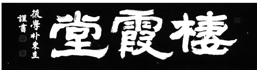
그림 4 서하당 현재 현판

현재 식영정 현판 글씨는 팔분체가 아닌 전서이며 정확하게는 소전(小篆)에 가까운 서체이다. 임진왜란 당시 불에 타버린 식영정을 이후에 중건하면서 현재까지 전해져 온 것이 아닌가 싶다. 현재 현판 글씨는 전남 보성 출신 송곡 안규동(松谷 安圭東, 1907~1987)이 썼다고 하나 관련 자료가 없어 정확치 않다. 식영정 아래 부용당 현판을 쓴 안규동이 식영정 현판까지 쓴 것이 아니겠는가 하고 짐작할 뿐 정확한 것은 아니다.