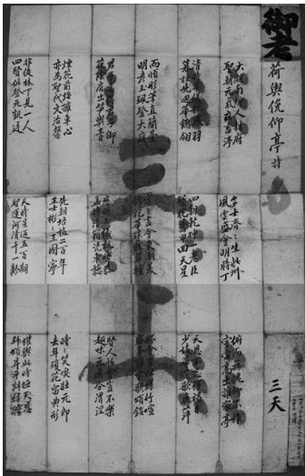
그림 3 1798년 김재박이 광주 도과에 응시하여 제출한 시험답안지(詩)

기학경은 1783년(정조 7) 사마시에 합격하고 1797년 『대학연의』 등의 교정에 참여하고 1798년 광주목 도과에 합격하였다. 1801년(순조 1) 문과에 급제한 뒤