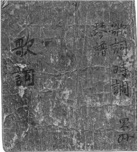
[그림 1] 속표지