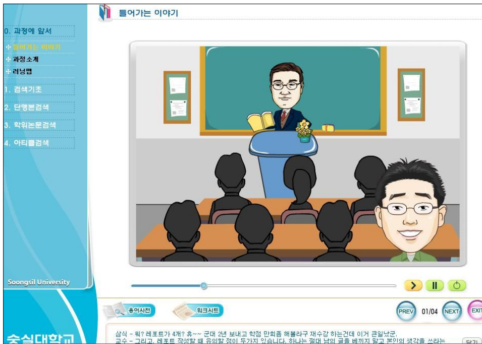
<그림 4> 개발화면 예시

웹기반 정보활용교육에 참여한 학습자들은 교육 후에 평균 19점의 향상도를 나타냈다 이러한 점수 차이가 의미가 있는 지를 알아보기 위하여 t검증을 해본 결과 p < 0.01 수준에서 유의미