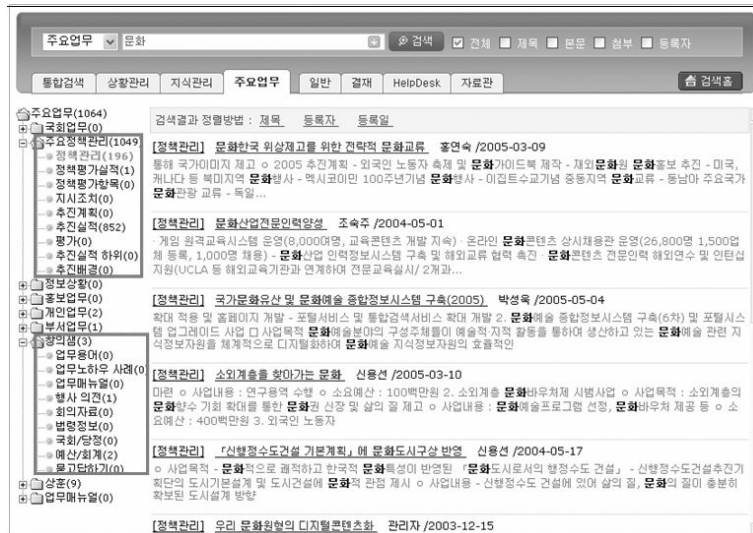
〈그림 3〉 지식경영시스템과 기록관리시스템의 통합 검색 결과