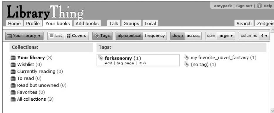
〈그림 2〉 Librarything-your books-Tags 화면 5)

인 정보를 얻을 수 있고, 이를 바탕으로 또 다른 태그를 추가할 수 있기 때문에 개인적인 유용성을 높일 뿐만 아니라 풍부한 태그의 구축을 유도할 수도 있다.