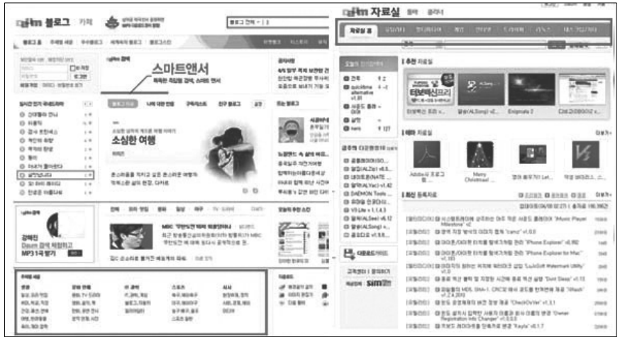
〈그림 2〉 다음 인터페이스의 다양성