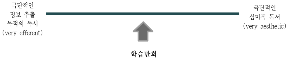
〈그림 1〉 로젠블랫의 정보 추출 목적의 독서와 심미적 독서의 연속체 (Efferent/Aesthetic Continuum)

입장을 취하느냐에 따라 독서의 초점이 달라진다고 했다. 정보 추출을 목적으로 독서하는 경우 독자는 독서 후에 얻어지는 것들, 즉 정보, 문체에 대한 논리적인 해결, 구체적인 해결방법 등에 관심을 가진다. 반면 심미적인 독서를 하는 경우 독자는 독서행위를 하는 바로 그 순간에 일어나는 일들, 즉 연상(聯想), 감정, 태도, 생각 등에 초점을 맞춘다(Rosenblatt 1978, 23-25). 일반적으로 신문이나 법적 보고서 등은 정보 추출 목적의 독서 방법으로, 시나 희극 등은 심미적 독서 방법으로 읽힌다. 그러나 어떤 텍스트이건 독자의 선택에 따라 심미적으로 읽힐 수도 있고 정보 추출 목적으로 읽힐 수도 있다 (Rosenblatt 1986, 123-124).