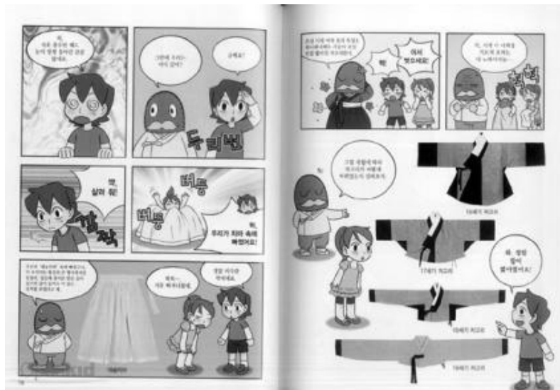
〈그림 3〉 『자연을 닮은 우리 옷 한복』 중

한 학습만화는 만화가가 이아린이 만든 『자연을 닮은 우리 옷 한복』 7) 이었다. 이 책에 대한 학생들의 반응은 매우 좋았다. 담임교사 A는 만약 학급 독서시간에 읽을 책으로 한복에 대해 설명하되 그림이 없고 글로만 설명되어 있는 책을 골랐더라면, 많은 학생들이 읽으려고도 하지 않았을 것이라고 했다. 또한 책을 읽더라도 (내용이 길고 지루해서) 한복에 대해 나쁜 인상을 갖게 되거나 한국 역사가 지루하다는 생각을 갖게 되었을지도 모른다고 했다. 그러나, 이 학습만화책을 읽은 후로 담임교사 A의 반 학생들 모두가 그 책이 너무나 재미있었다는 이야기를 했다고 한다. 어떤 학생들은 심지어 한복이 이렇게 멋있는 옷인 줄 몰랐었다고도 했다. 이 때의 경험을 통하여 담임교사 A는 “아하, 어린이들은 이렇구나. 이렇게 만화 형태로 쉽게 설명을 해주니까 아이들이 참 좋아하는구나.”라고 생