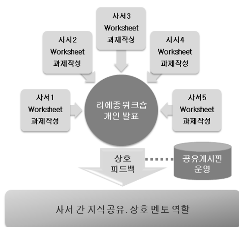
<그림 4> 리에중 교육 진행 방법

리에중사서는 주도적이며 적극적인 자세로 업무를 추진해야 하고, 사서 자신과 리에중서비스 이해 당사자 모두를 이끄는 리더십을 발휘해야한다. 교육 방법은 팀 학습 활동으로 진행하며 개인은 개별적으로 학습하되, 개인을 그룹으로 모아서 학습자 상호간에 발표와 조언을 통하여 서로의 지식과 업무능력을 공유할 수 있도록 한다. 그 내용은 <그림 4>와 같다.