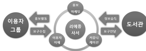
〈그림 1〉 리에중사서의 개념

전적 방향으로 진행하기 위하여 그 명칭을 종합적으로 아울러 나타낼 필요가 있다. 이에 따라 본 연구에서는 총체적 사서를 현 시대에 적합하게 설명할 수 있는 것은 이용자 그룹 분담, 도서관의 대표적 역할, 이용자와의 커뮤니케이션을 포괄하는 리에중사서의 개념이라고 보고, 이들을 통칭하기 위하여 리에중사서라는 용어를 채택하였다.