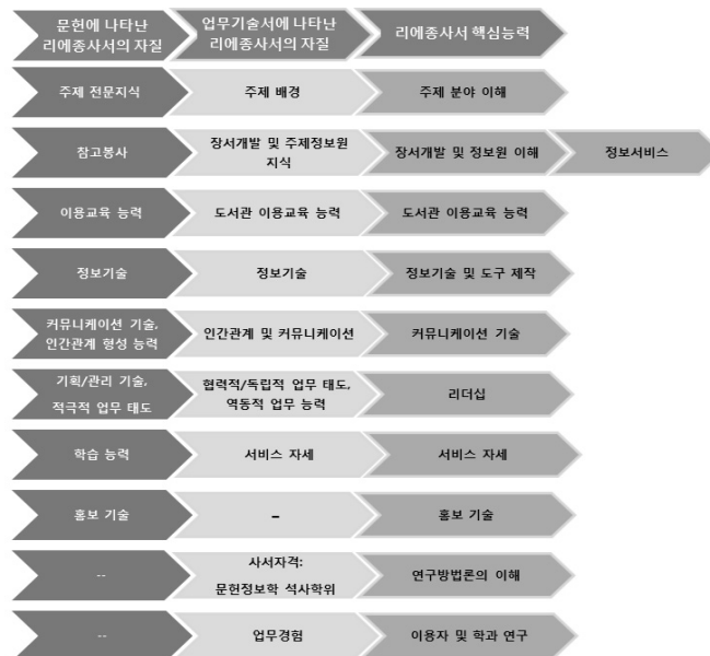
<그림 2> 리에종사서의 핵심 능력

앞에서 살펴본 문헌과 업무기술서의 내용을 종합하여 리에종사서의 핵심능력을 주제 분야 이해, 장서개발 및 정보원 이해, 정보서비스, 도서관 이용자교육 능력, 정보기술 및 도구 제작, 커뮤니케이션 기술, 리더십, 서비스 자세, 홍보 기술, 연구방법론의 이해, 이용자 및 학과 연구 등으로 추출하였다. 그 내용은 <그림 2>와 같다.