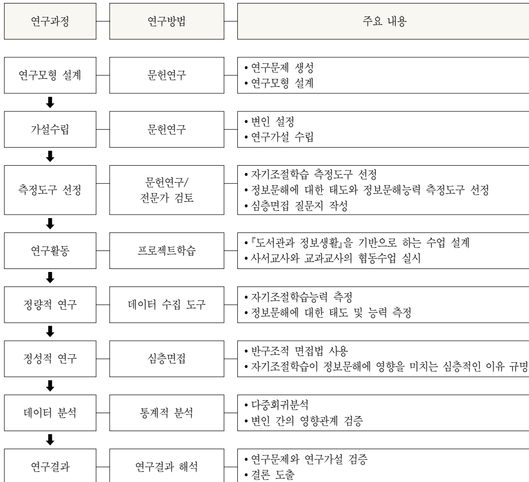
〈그림 2〉 연구절차

가설 5. 학교도서관 프로젝트학습에서 자기조절학습의 동기조절능력은 정보문해능력에 영향을 미칠 것이다.