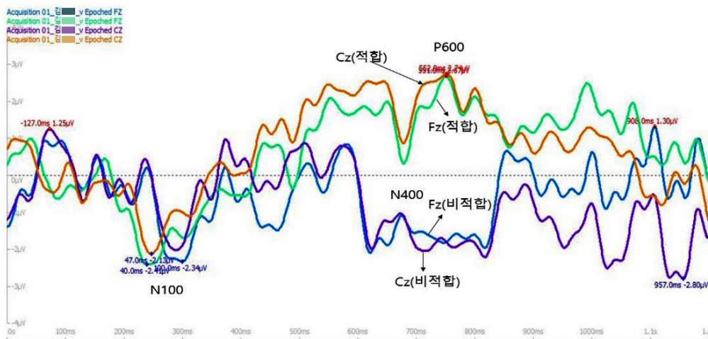
<그림 2> N400(Fz)과 P600(Cz)