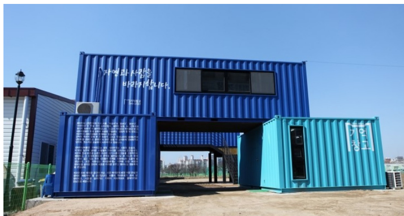
〈그림 1〉 시흥시 기억창고 1)

곳에 가봐야만 알 수 있는, 지역민이 아니면 알 수 없는 콘텐츠를 수집하여 전입책자를 편찬하였다. 이는 시흥에 이사 오거나 방문한 사람들에게 보다 더 유익한 정보를 제공해주는데 큰 도움이 되었다. 또한 시흥시의 재개발로 인해 사라질 위기에 처한 마을을 직접 방문하여 기록물을 수집하는 등 시흥의 기억들을 보호하고자 노력하고 있다. 이러한 활동들을 통해 기록물들이 쌓여 이를 보관할 장소가 필요하게 되자, 컨테이너 박스를 활용한 기억창고를 만들었다. 이곳은 단지 기록물을 보관하는 장소에 그치지 않고 기록물을 직접 수집한 주민들이 해설사로 활동하여 어린이집, 유치원, 초·중·고 학생들을 대상으로 기록물에 얽힌 이야기와 마을 곳곳의 유래를 알려주고 있다. 이렇듯 전시·보관된 기록물은 시흥의 모습을 간접적으로 체험하고 그 시대의 추억을 되살릴 수 있을 뿐 아니라 시흥이라는 지역을 이해하는데 도움이 될 것을 예상할 수 있다(전혜선 2016).