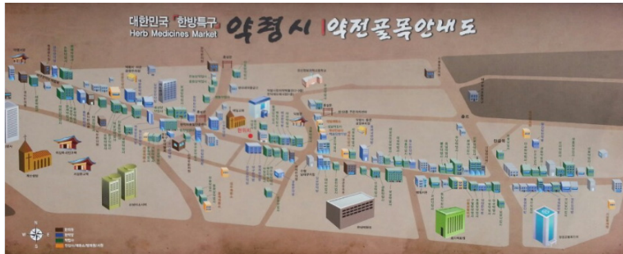
〈그림 2〉 약령시 약전골목 안내도