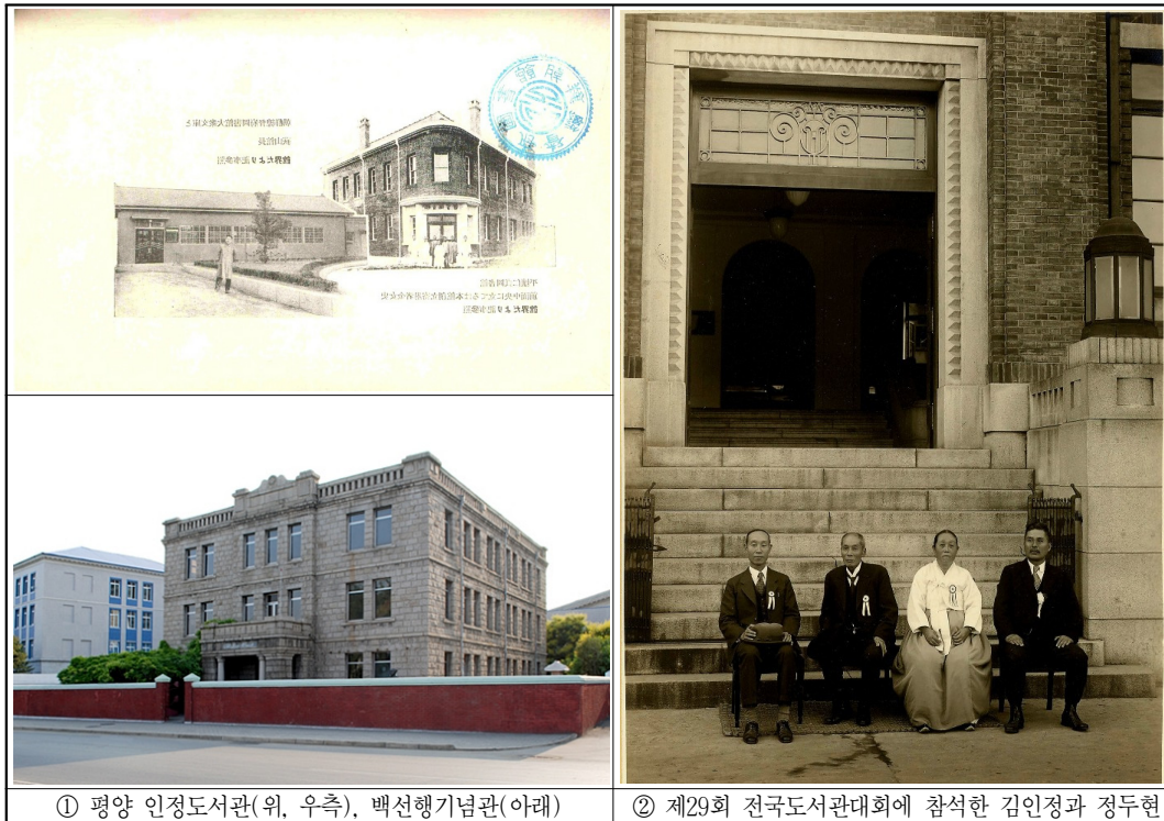
① 평양 인정도서관(위, 우측), 백선행기념관(아래)