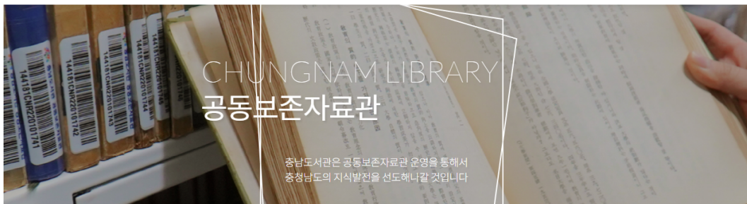
<그림 2> 충남도서관의 공동보존자료관 홈페이지