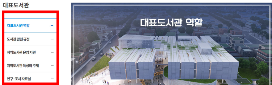
〈그림 3〉 부산도서관의 대표도서관 접근점 및 서브 메뉴 화면

원 및 협력, 지역도서관 서비스 연구 및 개발·보급을, 지역도서관 특성화 주제에는 도서관별 특성화 주제를, 연구·조사 자료실에는 도서관 용역연구 결과물을 파일과 함께 제공하였다.