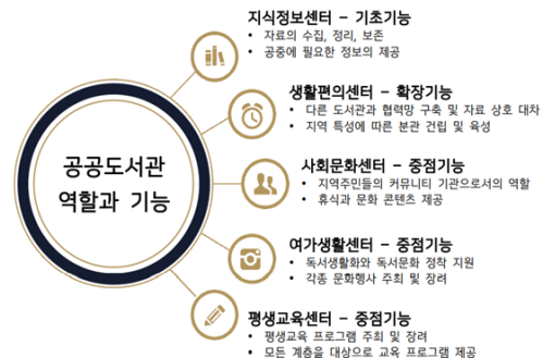
<그림 1> 공공도서관 역할과 기능

또한 한국도서관협회에서 발행한 『한국도서관 기준』에서는 공공도서관의 목적을 다양한 자료와 시설, 봉사활동을 통하여 지역주민의 정보이용, 문화 활동, 평생교육을 증진함으로써 지역사회의 지식 향상과 문화 발전을 도모한다고 밝히고 있다. 문화체육관광부에서는 지식과 정보의 공유 및 독서 공간이라는 도서관 본래의 목적 이외에 문화 다양성의 수용, 지역사회 구성원들의 이해와 소통, 그리고 우리의 미래를 담보할 수 있는 의미 있는 통합공간으로 거듭나야 할 필요성을 제기하면서 도서관의 역할과 기능을 <그림 1>과 같이 제시하였다(문화체육관광부, 2019).