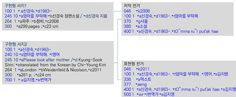
〈그림 2〉 저작의 전거형접근점과 표현형의 전거형접근점

KCR5의 저작 및 표현형 속성을 기술할 KORMARC 전거 및 서지레코드의 필드 및 식별기호를 파악하기 위해 Kincy와 Layne(2014), Hart(2014), Maxwell(2014)의 연구에서 RDA의 속성을 기술하는 MARC21 필드 및 식별기호를 조사하여 국내 전문가에 배포한 후 전문가의 자문 내용을 바탕으로 최종(안)을 〈표 4〉, 〈표 5〉와 같이 도출하였다. 전문가들은 500 일반주기에 기술된 내용에 대해 특별한 필드와 식별기호를 제안하였으며 본고는 이를 다음과 같이 반영하였다.