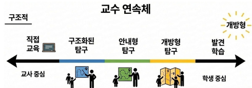
<그림 1> 교수 연속체에서의 다양한 접근

수준에 도달할 수 있음을 강조한다(Marschall & French, 2021/2021).