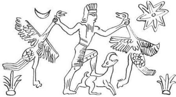
신아시리아의 원형인장에 새겨진 타조와 염소를 길들이고 있는 '동물들의 주'에 대한 표현