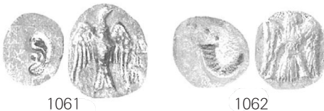
Hendin, 윳글 (2010), 131.