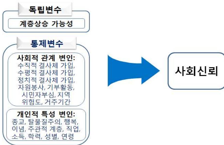
〈그림 1〉 본 연구의 분석틀

우선 “사회적 관계 변인”으로는 수직적 결사체, 수평적 결사체, 정치적 결사체 참여여부, 9) 자원