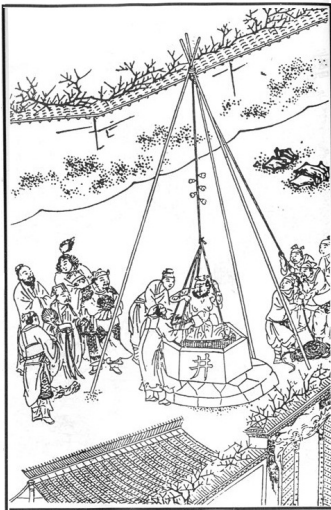
[그림 13] ‘공간 전개형’ 삽화.

이러한 ‘공간 전개형’ 삽화는 기존의 서사 내용을 보충하는 것은 물론이요, 기존 용여당 본 삽화의 부족한 점을 보완하는 역할을 한다고 볼 수 있다. 이는 거꾸로 말해 용여당 본의 부족한 점을 ‘공간 전개형’ 삽화가 보완한다고 할 수 있다. [그림 13]과 [그림 14]는 동일한 장면을 그린 것으로 ‘인물 활극형’ 유형과 ‘공간 전개형’ 유형이 어떻게 다른지 잘 보여준다. 소설의 제54회에 나오는 “흑선풍이 우물에서 시진을 구하다”(黑旋風下井救柴進) 대목으로, 고당주를 점령한 송강의 군사가 시진의 행방을 찾다가 우물 속에 버려진 것을 알게 되었을 때 이규가 내려가 구하는 장면이다. 이를 보면 ‘인물 활극형’이 동작 자체에 주목하는데 비해, ‘공간 전개형’은 보다 넓은 배경과 많은 인물을 통해 전체적인 상황을 주목한다.