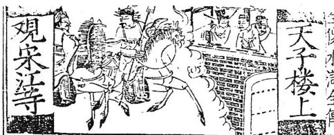
[그림 5] 누대에서 천자가 송강 등을 바라보다.