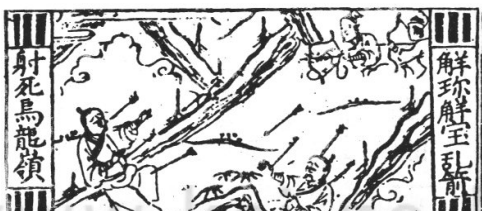
[그림 4] 오룡령에서 화살을 맞은 해진과 해보 형제