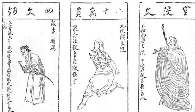
(그림 15) 《수호 엽자》. 왼쪽부터 시천, 사진, 노지심.

처음에 화가는 종이 놀이패로 사용하기 위해 그렸지만, 청대의 여러 《수호전》 삽화본에서 이를 수상으로 사용하였다. 이러한 인물을 하나씩 세워 그리는 형식은 현대에도 여전히 이어져 황영옥(黃永玉)과 대둔방(戴敦邦)의 그림 등에서 볼 수 있다. 14)