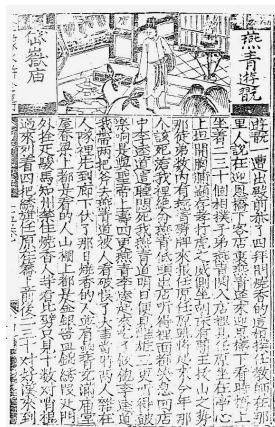
[그림 2] 《삼증 전호 왕경 충의 수호전전》

이러한 상도하문형은 그림과 글을 동시에 본다는 점에서 글과 그림의 상호 보완적 작용이 극대화되고 가장 효율적으로 표현됨은 말할 나위가 없다. 다만 그림에 있어서는 상하의 폭이 곧 서 있는 사람의 키의 최대치가 되기 때문에 5)