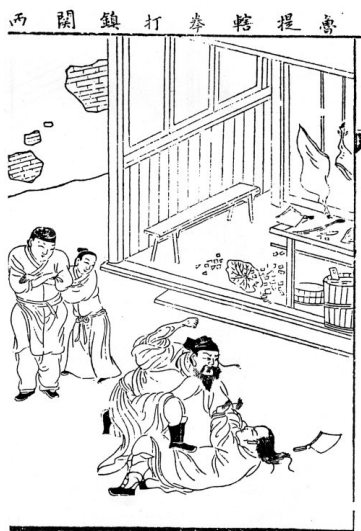
[그림 8] 석거각 보간본

용여당 본의 그림은 이후로 계속 모사본이 나왔다. 명대 말기 종성(鍾惺)의 이름을 가탁해 비평한 사지관(四知館) 간행의 《중백경 선생 비평 충의수호전》(鍾伯敬先生批評忠義水滸傳) 100회본도 이 계통의 그림임을 알 수 있다. 파리 국가도서관 및 일본 신산윤차(神山潤次)에 소장된 것으로, 책의 앞머리에 '수