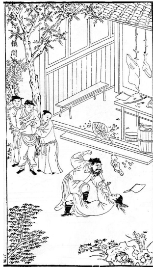
[그림 10] 《영웅보》