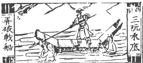
[그림 3] 물속에서 전함 바닥을 뚫는 완씨 삼형제

예컨대 [그림 3]에서 보이는 “완씨 삼형제가 전함의 바닥을 뚫다”(三阮水底弄破戰船) 장면은 원래 관군의 공격에 대해 완씨 삼형제가 물속에 들어가 정으로 전함의 바닥을 뚫어 가라앉히는 장면인데 그림이 상하의 폭을 주지 못하기 때문에 인물들은 물 밖에 나와 있고, 전함조차도 전함이라 부르기 어려울 만큼 단순하게 처리되었다. [그림 4]에서도 “해진과 해보가 오룡령에서 화살을 맞고 죽다”(解珍解寶亂箭射死烏龍嶺)를 그린 것으로 소설 말미의 오룡령 전투에서 잠입하려고 절벽을 오르던 해진과 해보 형제가 화살에 맞고 떨어지는 장면인데, 원래 가파르고 높은 절벽을 표현하려면 세로로 긴 화면이 필요하나, 여기서는 어쩔 수 없이 그러한 높이를 만들지 못해 비스듬히 그리면서 벼랑의 험난함이 드러나지 않게 되었다.