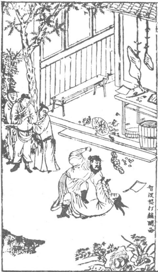
[그림 9] 《중백경 선생 비평 중의 수호전》

호전인품평'(水滸傳人品評)이 있고 그곳에 그림이 39폭이 그려져 있다. 천계(天啓) 연간(1622-1627)에 간행한 것으로 한 눈에 보아도 그림을 용여당 본에서 배긴 것이며, 인물평의 내용도 마찬가지로 용여당 본의 것을 배겼다. 10) 화면은 상하로 폭이 늘어났기 때문에 푸줏간은 지붕의 기와가 보이며, 푸줏간 앞마당에도 수석과 수목이 그려졌다. 그리하여 원래 푸줏간 앞은 길거리여야 적절할 것이나 수석과 수목을 그리다 보니 정원의 모습처럼 바뀌어졌다. 구경꾼은 원래 악동 같은 표정이었는데 다소 다듬어졌고, 일꾼의 옷차림도 다소 단정하게 바뀌어졌으며, 그들 뒤에도 전에 없던 나무가 자라나 있다. 주위의 배경에 집중하다 보니 주인공의 활극은 상대적으로 용여당 본에 비해 집중도와 생동감이 떨어졌다.