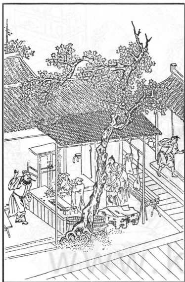
[그림 11] 화가 나 진관서를 치다

어려움을 겪게 된다. 그런데 ‘공간 전개형’ 그림은 두루마리의 효과를 단폭에 압축시키려 노력하였다. 임충과 노지심이 서로 알게 되어 의형제를 맺을 때의 모습을 그린 [그림 12]의 “채마밭의 만남”(菜園相遇) 대목은 비교적 잘 알려진 화면으로 스토리를 단폭에 집중시킨 성공적인 작품으로 인구에 회자된다. 이를 보면 공간은 크게 상단, 중단, 하단으로 나누어져 있고 각 공간 속에 각기 다른 인물들이 각기 다른 상황을 연출하고 있다. 먼저 하단에서는 노지심이 대상국사 채마밭을 관리하면서 알게 된 왈패들에게 무술 시범을 보여주고 있다. 중단에서는 무너진 담 사이에 임충이 턱을 쓰다듬으면서 이를 구경하고 있다. 상단에서 임충의 부인이 오악묘에 헌향하러 갔다가 태위 고구의 양아들 고아내(高衙內)의 희롱을 받고 있고, 시녀 금아(錦兒)가 이를 알리기 위해 급히 오악묘 문을 향해 달려가고 있다. 이들은 소설적 서사의 시간적 선 위에 있는 것이나, 화가는 이를 동시에 일어나는 것으로 모아놓음으로써 한 폭의 그림이 하나의 줄거리가 있는 복합적인 화면으로 바뀌게 되었다.