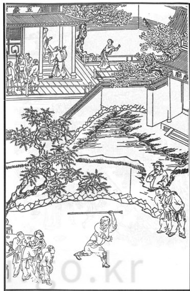
[그림 12] 채마밭의 만남