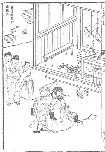
[그림 7] 용여당 본

용여당 본과 석거각 보간본의 그림을 비교하면, 일견 크게 다른 점이 없이 같은 그림으로 보인다. 그러나 제목이 용여당 본에서는 화면 속의 빈 곳(벽)에 들어간데 비해 석거각 보간본에는 상단으로 올라갔고, 왼쪽에서 지켜보는 인물도 보간본에서는 한 사람이 줄어들었다. 또 연잎도 석거각 본에서는 푸룻간 밖에 떨어진 것은 없어졌다. 노 제할의 바지도 원래 있던 문양이 지워졌다. 이러한 장면을 처음 제작한다는 것은 뛰어난 화가가 아니라면 어려울 것이나 아쉽게도 그 이름은 남아있지 않다.