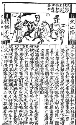
[그림 1] 건양 여상두본. 1594년

현존하는 《수호전》 판본 가운데 상도하문의 형식으로 삽화가 실린 대표적인 것으로는 1594년 건양(建陽) 쌍봉당(雙峰堂)에서 여상두(余象斗)가 펴낸 《경본 증보 교정 전상 충의 수호전 평림》(京本增補校正全像忠義水滸傳評林)이다. 이는 상단에 간결한 평어가 있어 실제로는 상평(上評), 중도(中圖), 하문(下文)의 형식을 하고 있으나, 기본적으로 상도하문의 건안과 형식이라고 할 수 있다. 총 104회 소설로, 현존하는 간본(簡本) 가운데 가장 먼저 나온 삽화본이다. 각 페이지 상단에 좁고 긴 공간 속에 전체 1,200여 폭의 그림이 들어가 있다.