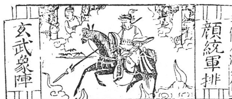
[그림 6] 올안 통군이 현무상 진영을 배치하다.

이들 삽화본 가운데 《신간 통속 증연 충의 출상 수호전》은 양쪽에 표제어를 각각 4자씩 고르게 배치하였고, 각 페이지가 아니라 펼침 페이지에서 한쪽에만 그렸다. 그림도 훨씬 정련되었다. 결국 이들 판본은 빠른 시기 동안 갈수록 정교하고 공간 표현이 풍부해졌음을 알 수 있다. 비록 좁은 공간 속에서 일어난 것이지만, 이들 삽화본 사이의 발전과 비약은 만력 연간에서 승정 연간까지 50년 사이에 일어났다. 이러한 장면 처리와 공간 해석은 화면이 한 면 또는 두 면 연결 형식으로 확대될 때 도움을 주었고 유사한 상황을 표현할 때 응용되기도 하였다.