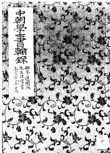
書影1. 《中朝學士書翰錄》의 封面

각 서신들은 발신자 별로 배접되어 摺帖의 형태로 엮어져 있는데, 제7신에 套格된 白紙가 사용한 것 외에는 대부분 正文 箋紙店에서 구입한 花箋 또는 畫箋이 사용되었다. 10) 예를 들면, 제1신은 紅黃白三色을 바탕색으로 하는 研光箋 11) 이