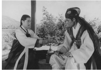
그림 6 1955년 <춘향전>