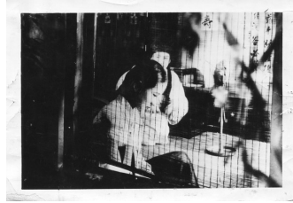
그림 2 1935년 <춘향전>(토키)