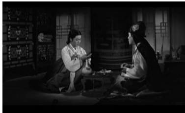
그림 8 1961년 <춘향전>(신상옥 감독)