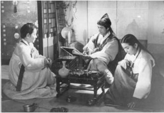
그림 5 1955년 <춘향전>