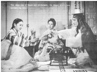
그림 7 1961년 <춘향전>(홍성기 감독)