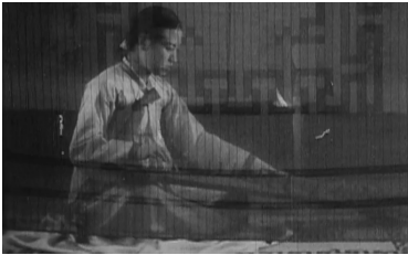
그림 3 1941년 <반도의 봄>