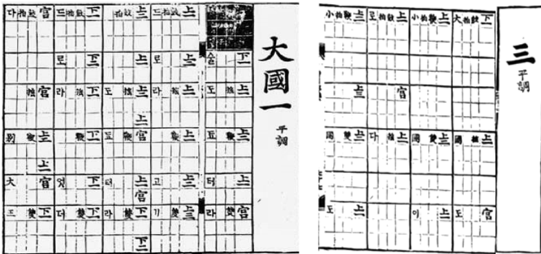
<보례 5> 『시용향악보』 대국1과 대국3

로 이어지는 악곡이다. 대국1·2·3·구천·별대왕에서는 ‘鼓搖鞭雙’의 네 장고점이 처음(대국1·2)에는 한 행에 나타났다가 중간(대국3, 구천, 별대왕 앞부분)에 두 행에 나타나고, 끝(별대왕 끝부분)에 다시 한 행으로 되돌아와서 끝난다. 18) 이 악곡들은 3분박 4박자에서 2분박 4박자로 템포가 빨라졌다가 다시 3분박 4박자로 되돌아와서 끝나는 것인데, 이러한 리듬은 지금도 천년만세와 같은 정악곡과 다른 많은 민속악곡에서 찾아볼 수 있다. 이와 같이 서로 이어져있는 악곡들을 통해서도 ‘鼓搖鞭雙’의 네 장고점이 한 행에 기보되어 있는 가시리 장단의 리듬은 3분박 4박자임을 알 수 있다.