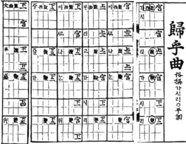
<보례 1> 『시용향악보』 가시리

<보례 1>의 가시리 악보에서 보는 바와 같이 ‘鼓搖鞭雙’으로 된 네 개의 장고점이 정간보 한 행의 5·3·5·3정간을 단위로 기보되어 있는데, 5·3·5·3정간에 나누어 있는 가시리의 각 장고점 단위에는 정간의 수에 관계없이 균등하게 1~2음과 0~2글자가 붙어 있다. 이렇게 5정간과 3정간으로 된 장고점 단위는 길이가 같은 기본박으로 해석되고 14) 그 박은 3분박으로 해석되어, 가시리의 리듬은 3분박 4박자로 해석된다. 15) 5정간과 3정간이 같은 길이의 기본박이 된다는 것은 우리말 가사 노래보다는 한시를 가사로 하는 노래에서 더 정확하게 드러난다. 일반적으로 한시를 가사로 하는 노래에서는 각 글자의 의미비중이 동등하기 때문에 각 글자의 길이도 같다. 우리말 가사의 노래에서는 각 글자의 의미비중이 동등하지 않기 때문에 각 글자의 길이가 동등하지 않다. 세종대왕이 작곡한 보태평 귀인은 한시 가사로 되어 있는데, 각 악곡의 장고점이 5·3·5·3정간을 단위로 기보되어