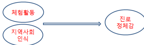
[그림 1] 연구모형