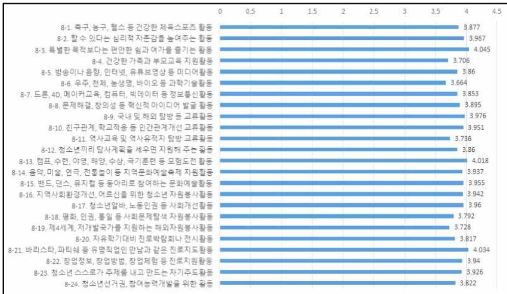
(그림 1) 청소년들이 원하는 활동 수준(평균)

교류영역에서는 국내 및 해외탐방 등 교류활동, 친구관계, 학교적응 등 인간관계개선 교류활동은 65%이상의 필요를 나타냈으나 역사교육 및 역사유적지 탐방 교류활동(59.3%)은 다른 활동과 비교할 때 그리 높은 필요를 나타내지는 않았다. 국내 및 해외탐방 등 교류활동과 역사교육 및 역사유적지 탐방 교류활동에 경기도 북부권역 청소년보다 경기도 남부권역 청소년의 요구가 더 높게 나타났다. 관계증진을 위한 활동에 대한 관심은 청소년기가 또래관계를 중시하고 그 관계 안에서 소속감을 느낄 때 만족을 느끼는 시기이므로 그 특징이 잘 반영된 결과라 할 수 있다.