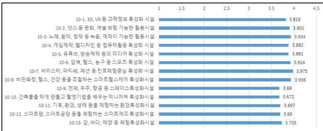
(그림 3) 청소년이 원하는 시설에 대한 요구

청소년들이 지역에 만들어지기를 원하는 시설에 대한 요구는 그림3과 같다. 우리 지역에 만들어지기를 원하는 시설에 있어서 바리스타, 파티쉐, 패션 등 진로체험중심 특성화시설 70.1%, 비만 측정, 헬스, 건강 등을 조절하는 스마트헬스케어 특성화시설 68.8%, 암벽, 헬스, 농구 등 스포츠특성화시설 67.9%, 노래, 음악, 창작 등 녹음, 제작이 가능한 활동시설 67.6%, 댄스 등 문화, 예술 체험 가능한 활동시설 67.3%, 유튜브, 방송제작 등의 미디어특성화시설 65.7%, 게임제작, 웹디자인 등 컴퓨터활용 특성화시설 65.6%, 3D, VR 등 과학정보특성화시설 62.7%, 강, 바다, 해양 등 체험특성화시설 58.4%, 기후, 환경, 생태 등을 체험하는 환경특성화시설 56.8%, 스마트팜, 스마트공장 등을 체험하는 스마트제조특성화시설 56.7%, 건축물을 작게 만들고 촬영기법을 배우는 미니어저 특성화시설 56.0%, 천체, 우주, 항공 등 스페이스특성화시설 54.8%로 모든 시설에 대한 50%이상의 필요를 표현하였고, 특히 진로체험중심의 시설의 필요를 가장 크게 요구하였고, 스마트헬스케어 특성화 시설, 스포츠특성화시설의 그 뒤를 이었다. 이러한 결과로 청소년