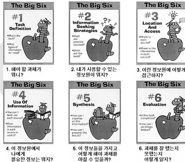
<그림 3> 정보문제 해결을 위한 Big6 모형