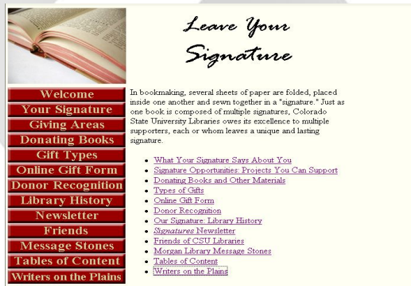
〈그림 2〉 콜로라도주립대학 도서관 개발 홈 페이지

〈그림 2〉에서와 같이 현재 콜로라도주립대학 도서관에서 제공하고 있는 도서관 개발의 방법은 새로이 신축된 Morgan Library를 위한 기금, 전자자원 및 서비스 기금, 수자원아카이브, 가상포스터수집, 야생 생물사진, CSU도서관의 친구들, 북동 콜로라도 평원을 기반으로 하는 작가들을 지원하는 프로그램이 서명을 기다리고 있다.