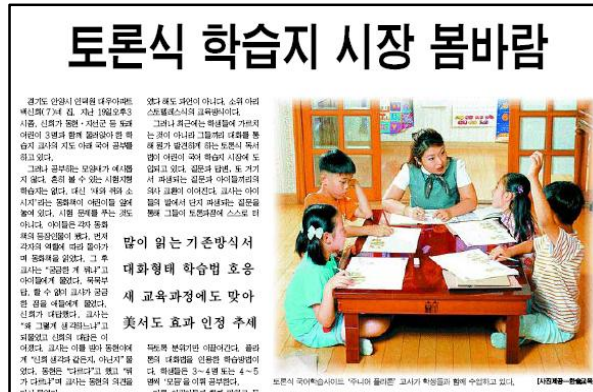
〈그림 10〉 “토론식 학습지 시장 봄바람”(중앙일보, 2002.3.20)