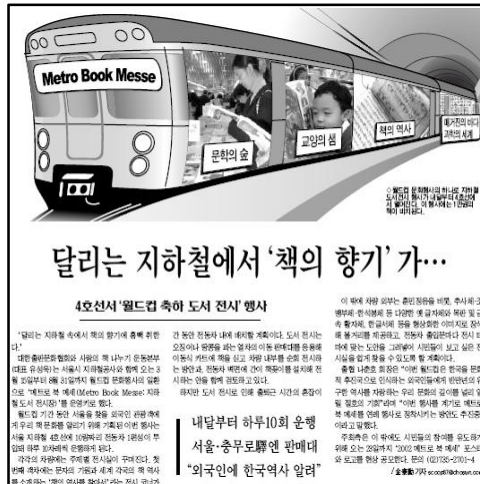
〈그림 2〉 지하철 책열차(메트로 북메세)(조선일보, 2002. 2. 6. 19면)

들어서 군 병영 내에 도서관을 건립해주는 “진중 도서관 건립 운동”이 펼쳐졌다는 점이다. 1999년 발족된 ‘사랑의 책 나누기 운동본부’는 교수·출판평론가 등 각계 인사로 구성된 추진위원 20명, 실무위원 20명을 중심으로 2003년 당시까지 모두 14곳의 진중 도서관을 개관했다. 도서관 한곳 당 평균 3,000여권 씩, 모두 1,500여 종 42,000여 권의 책을 군에 기증했다. 27) 여기에 국방홍보원 국군방송에서도 주간 독서 프로그램 ‘책마을 사랑방’을 장병과 일반 청취자들에게 선보였으며, 28) 2003년도에 국회에서는 ‘국가는 각급 부대에 병영도서관을 설치할 수 있다’는 내용의 신설 조항을 담은 도서관 및 독서진흥법 개정안을 통과시켰다. 이에 따라 국방부의 도서 구입 예산이 큰 폭으로 늘어날 수 있게 되었다. 29)