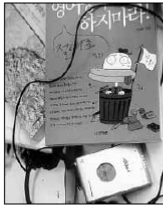
〈그림 7〉 MP3로 다운로드할 수 있는 오디오북 (중앙일보, 2000. 8. 16. 13면)