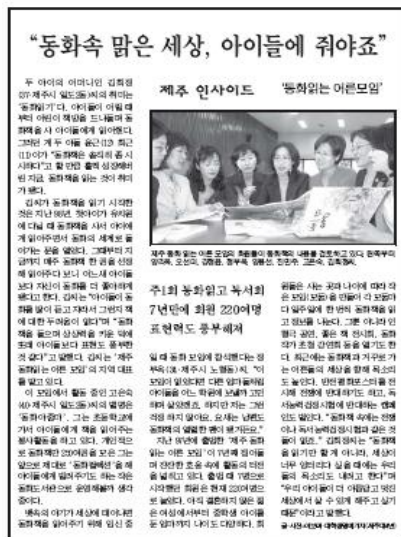
〈그림 3〉 지역마다 결성된 ‘동화읽는 어른모임’ (조선일보, 2004. 4. 23. A14면)

‘강릉 동화읽는 어른 모임’은 1년에 한번씩 동화구연 공연을 했다. 그림자극, 슬라이드극 등으로 일반인들에게도 알려져 성황을 이루었다. 30) 또 전주의 ‘온고을 동화 읽는 어른 모임’ 회원들은 아이들의 눈높이에 맞는 동화책을 골라 함께 읽은 뒤 정기적으로 만나 토론하고 독서 지도를 어떻게 할 것인가 등의 고민을 나누었다. 이들은 책 속에만 갇혀 있는 게 아니라 아이들과 함께 갯벌탐사에 나섰고 수목원 등으로 ‘들풀기행’을 가기도 했다. 또 ‘내고장 작가와의 만남’이나 신문을 활용한 NIE 교육도 실시했다. 가을이면 ‘동화와 함께 한 문화 한마당’을 열어 책의 축제를 마련했다. 31) ‘동화 읽는 어른들의 모임’은 각 지역마다 결성되어 있었는데 다른 어떤 단체보다 어린이 독서운동에 기여하는 바가 컸다.