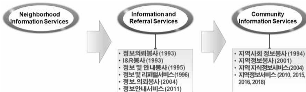
<그림 1> 국외 용어의 추이에 따른 국내 용어의 변화

이처럼 대표용어를 규정하고 본질적 의미에 대한 광범위한 논의를 지속해온 국외와 달리, 국내의 용어를 살펴보면 국제적으로 사용되어 왔던 용어들을 번역하여 사용해 왔음을 추측할 수 있다. 앞서 살펴본 <표 1>의 국내 용어들을 국외의 용어와 연결시켜보면 <그림 1>과 같이 도식화할 수 있는데, 국내의 다양한 용어들은 북미에서 사용되어온 ‘Information and Referral Services’와 ‘Community Information Services’를 어떻게 번역하였느냐의 차이에서 기인한 것임을 짐작할 수 있다.