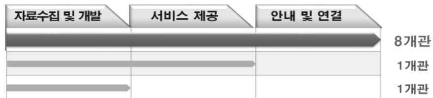
〈그림 3〉 커뮤니티 정보서비스 범위에 대한 인식

나아가 도서관 현장에서 생각하는 커뮤니티 정보서비스의 인식에 대해 살펴보기 위해 서비스의 범위를 어디까지 보고 있는지에 대해 살펴보았다. 앞서 커뮤니티 정보서비스의 정의에 따른 세 가지 측면에 근거하여 살펴본 결과, <그림 3>에서 나타나듯이 절대 다수의 사서들(80%)은 지역대표도서관에서 제공해야 할 커뮤니티 정보서비스의 범위로 지역주민들의 일상적 요구(지역주민의 건강, 교육, 관광 등)를 위한 ① 자료수집 및 개발, ② 정보의 제공, ③ 제공이 불가능할 경우 타 기관으로의 안내 및 연결까지 아우르는 광의의 개념으로 인식하고 있었다.