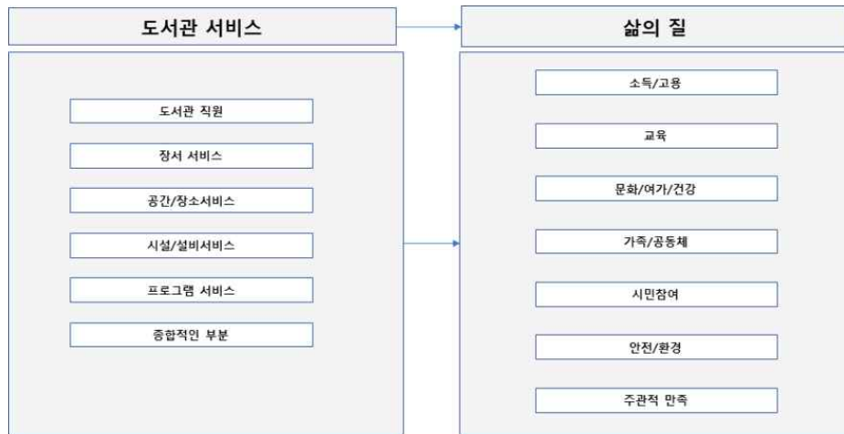
<그림 1> 연구모형

H1. 도서관 직원은 삶의 질(H1-1.소득/고용, H1-2.교육, H1-3.문화/여가/건강, H1-4.가족/공동체, H1-5.시민참여, H1-6.안전/환경, H1-7.주관적 만족)에 정(+의 영향을 미칠 것이다.