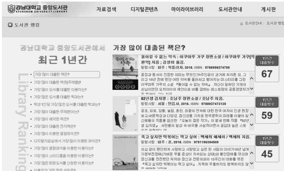
<그림 5> 경남대학교 중앙도서관 '도서관 랭킹' 서비스 (경남대학교 도서관 홈페이지)

독서 프로그램 이외에도 기초교양교육 지원으로 도서관 이용기록(대출, 독서경향 등) 및 학업정보(전공, 학년 등) 분석을 바탕으로 맞춤형 도서 추천서비스를 지원하는 과제가 제시되었다. 전국 대학도서관들은 도서관의 대출, 이용자, 장서 등의 수치화된 데이터를 활용하여 도서 추천 서비스 및 정보서비스에 활용하는 경향을 보이고 있다. <그림 5>는 경남대 도서관에서 도서 대출과 이용 현황을 분석하여 제공하는 랭킹 서비스이다.