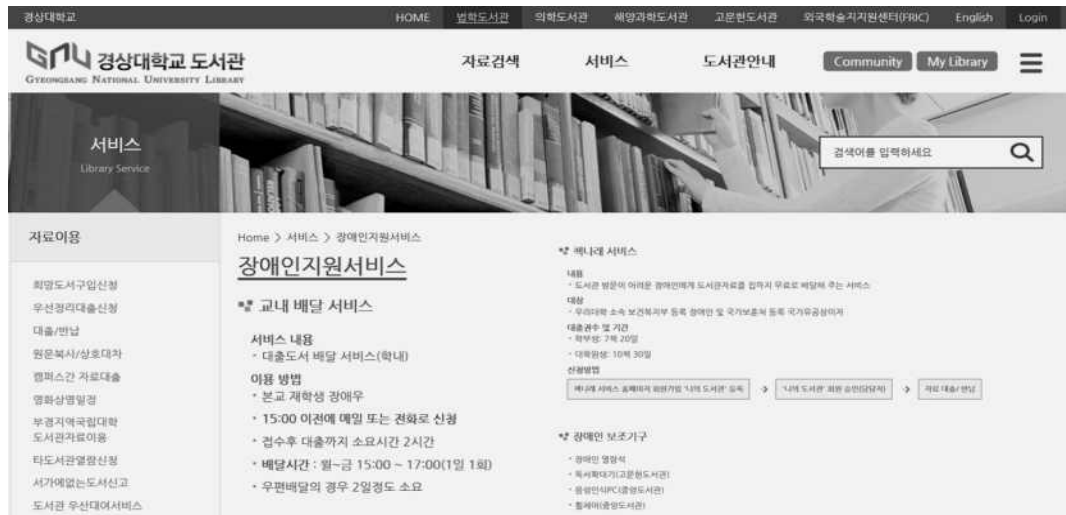
<그림 7> 경상대학교 도서관의 장애인지원서비스(경상대 도서관 홈페이지)