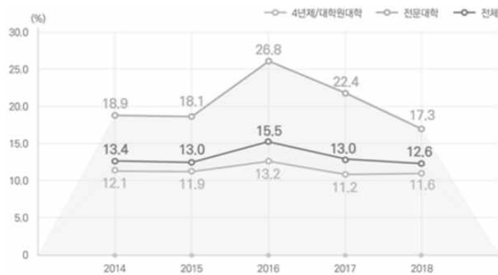
<그림 4> 2014~2018 전국 대학도서관의 재학생 대비 연간 이용교육 참가자수 비율 (한국교육학술정보원 2018)

학습윤리교육 지원의 내용은 학부생의 학습윤리 개념 습득을 위한 과제물 및 소논문 작성법 교육, 대학원생의 예비 연구자로서의 윤리의식 고취를 위한 학위논문작성법 교육 등의 프로그램을 운영하는 것이다. 대학별로 학습윤리교육과 관련된 과제는 도서관 이용교육에 포함하였으며, 이와 관련하여 2018년 대학도서관 통계조사 결과 도서관의 이용교육 관련 지표는 <그림 4>와 같다.