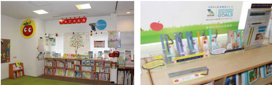
<그림 2> 도시마구립중앙도서관의 사과의 선반 (豊島区立図書館홈페이지)

도쿄에 위치한 도시마구립중앙도서관은 타깃 이용자를 위한 별도의 서가를 배치하는 방식으로 상시적인 장애인서비스를 운영하고 있다. 서가의 이름은 <그림 2>와 같이 “사과의 선반”으로 장애인을 대상으로 한 서비스 공간이다. 사과의 선반은 특별한 요구가 있는 아이를 위해 접근이 쉬운 책을 모아놓은 코너를 일컫는 말로 장애인을 위한 코너라는 표현 대신 활용되고 있다. 도시마구립중앙도서관의 서가는 유아도 닿는 높이로 만들어져 있으며, LL북, 수화의 책, 천의 그림책(대·중·소), 만져서 즐기는 책, 큰 문자의 책, 멀티미디어 DAISY도서, 이야기·동요CD, 다양성을 생각하게 하는 책이 갖추어져 있다. 선반 위 쪽으로는 독서배리어프리에 관련한 팸플릿, 리딩트래커 등과 배리어프리 도서에 대한 안내문을 전시하고, 보호자용으로 『다양한 배움의 시트』를 준비하여 구의 교육 지원에 관한 정보를 제공하고 있다. 이후 예상을 넘는 대출과 장애인의 도서관 방문으로 서가의 이용률이 높아졌으며 전국의 공공도서관에서 벤치마킹하고 있다.