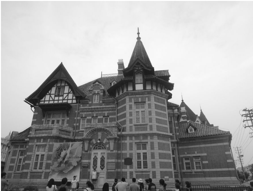
[사진 21] 러시아풍경구 초입 미술관 건물

남산일본거리에 흩어져 있는 일본식 주택들을 둘러본 후, 우리는 러시아 풍경구로 향했다. 다렌은 청일전쟁 후 러시아가 조차(租借) 받아 건설한 항만 도시로, 러일전쟁 후에는 일본이 50여 년 동안 조차하여 자유항으로 삼고 남만주철도회사 본사를 두는 등 만주 식민화의 거점으로 활용한 도시이다. 눈 깜빡할 새에 지나간 답사 첫째 날에 보았던 다렌이 치열한 전쟁과 죽음의 흔적을 지울 수 없는 장소로 다가왔다면, 오늘 본 다렌은 근대에 이 땅을 점거하고 흘러갔던 ‘제국들’이 아직도 생생히 살아 숨 쉬는 도시로 느껴졌다. 옛 ‘제국’의 숨결이 가장 풍부하게 드러난 곳 중 하나가 바로 다렌 항에서 이어지는 이 러시아풍경구가 아니었나 싶다.