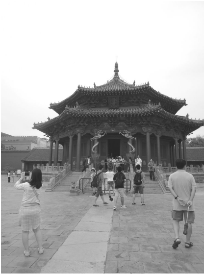
[사진 6] 선양고궁 대정전 전경

었다고 한다. 이 궁전의 건축물에는 한족, 만주족, 몽고족의 양식이 융합되어 있어, 자금성이나 베이징고궁처럼 한족 문화의 영향이 강한 곳들과는 매우 다른 분위기가 난다고 한다.