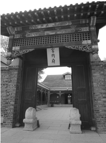
[사진 8] 위황궁 궁내부 입구

리 초라하다는 느낌은 전혀 들지 않았다. 또한 서양식으로 돌을 쌓아 만든 건물이라 하더라도 근민루, 집회루, 동덕전 등의 지붕은 황색 유리기와를 얻는 등 절충적 특징을 잘 살린 건물들이 대부분이라서 상당히 새로운 경관을 보여주고 있었다. 이처럼 서로 다른 문화의 혼합을 허용함으로써 새로운 형태의 경관을 만들어냈다는 특징은 신민대가의 팔대부를 통해서도 잘 알아볼 수 있었다.