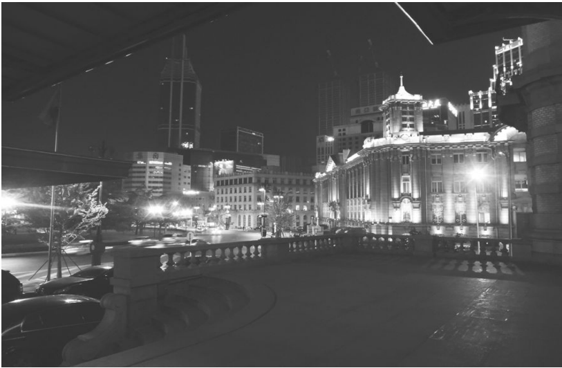
[사진 5] 다렌빈관에서 바라본 중산광장 전경

였다는 실감이 났다. 짐을 풀고 나서 김창호 선생님의 인솔 아래 거의 모든 사람들이 중산광장 일대를 돌아보고 야경을 즐기러 나갔는데, 감기로 탈진한 나는 눈물을 머금고 감기약을 먹고 자기로 했다. 종합감기약을 챙겨 와서 다행이라고 혼자 위로하면서, 그렇게 만주 답사의 첫날은 지나갔다.