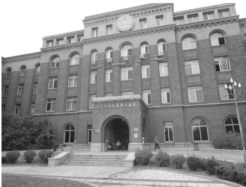
[사진 20] 중산의원

사를 두었다고 한다. 만철은 철도사업을 중심으로 하여 광업, 제조업, 호텔업 등 광범위한 분야에 걸친 복합기업으로 성장하여 만주 식민화의 핵심 기관 역할을 하였지만, 지금은 뚜렷한 표지 없이 사용되는 사무용 건물로 보였다. 만일 선생님들과 함께 오지 않았다면 그저 낡은 건물이라 보고 무심하게 지나쳤을 것이 분명하다. 카메라 앵글에 제대로 다 들어오지 못할 정도로 크고 긴 이 건물은 지금도 선양철도국 사무실로 운영되고 있었는데, 내부를 자세히 둘러보지는 못하고 나올 수밖에 없었다.