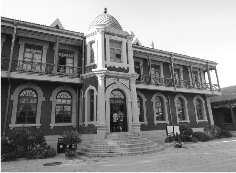
[사진 9] 위황궁 근민루 전경

황궁을 돌아나가자 역시 기념품 가게가 즐비했는데, 옛날 만주 지도 도록처럼 탐을 낼만한 서적들이 상당히 많았다. 나는 바깥에 앉아서 바람이나 쐬다가 일찌감치 후문으로 나가서 기다리고 있었는데, 재미있게도 선생님들이 똑같은 책을 들고 하나둘 씩 후문을 나오시는 것이었다. 함박웃음을 지으며 ‘득템’하셨다고 나오신 선생님들의 손에 들린 똑같은 책들은 모두 가격이 달라서, 최고가는 최저가의 다섯 배 정도나 되었다. 결국 흥정의 베테랑만이 승리를 만끽하며 기념사진을 찍을 수 있었다. 바람이 많기로 유명한 창춘에서는 연날리기가 성행한다고 하는데, 위황궁 후문 바깥에서도 석양을 배경 삼아 연을 날리는 아이들을 볼 수 있었다.