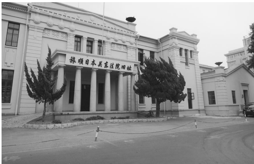
[사진 3] 구 관동군법원

전체적으로 색채가 매우 적은 감방은 흰 회벽과 나무로 짜 맞춘 회색 문, 닳아서 반들반들한 마룻바닥, 나무로 만든 집기 등으로 단출하게 꾸며져 있었고, 판옵티콘을 금세 떠올리게 하는 감시대가 방사형으로 뻗은 복도의 정중앙에 위치해 있었다. 간수들이 복도를 다니면서도 아래층을 감시할 수 있도록 바닥에 창살을 댄 구멍이 뚫려 있기도 했다. 또한 수감자들의 다양한 국적을 증명하듯 중국어, 한국어, 일본어 등 3개 국어로 감옥 규칙이 붙어 있었다. 적벽돌로 쌓은 건물과 담장 사이에는 시야를 가리는 것 없이 뽕 풀린 풀밭이 있어서 너머의 건물이 훤히 들여다보였다. 건물이나 부지에 전체적으로 감시에서 벗어날 수 있었던 곳은 거의 아무 데도 없었다. 수감자들은 살아서 감옥 문을 나서지 못했다면 통에 들어간 시체가 되어 땅에 묻혔을 때라야 비로소 그 시선으로부터 벗어날 수 있었을 것이다.