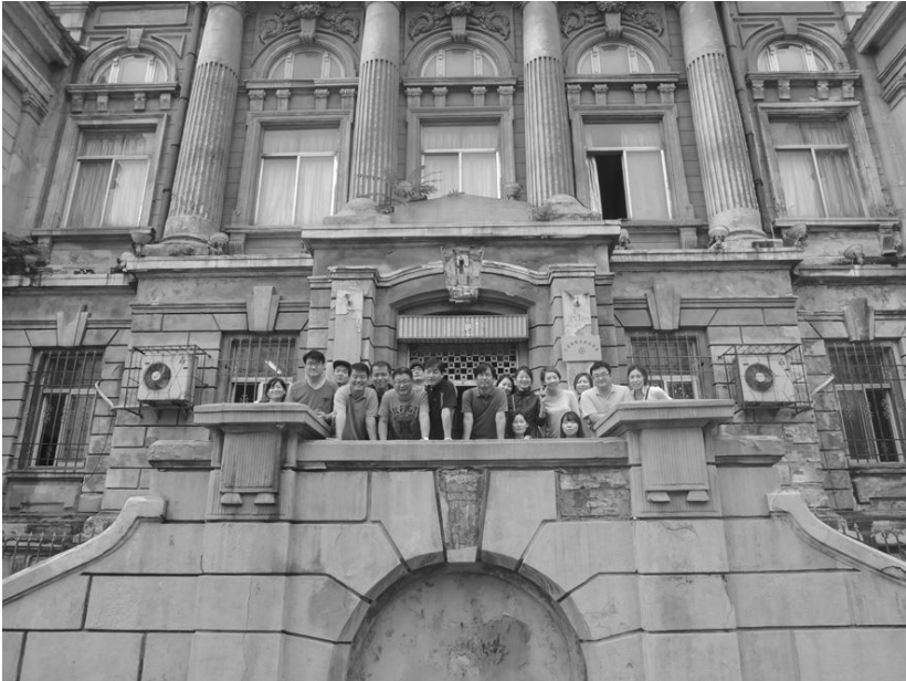
[사진 19] 구 만철 본사 앞에서

몇 번이고 접시를 비우고 커피와 주스를 마셔대면서 기력을 회복한 우리는 흐뭇하게 기념사진을 찍고 마지막 날의 일정을 기운차게 시작할 수 있었다. 마지막 날 처음으로 방문한 곳은 다렌만철본사였다.