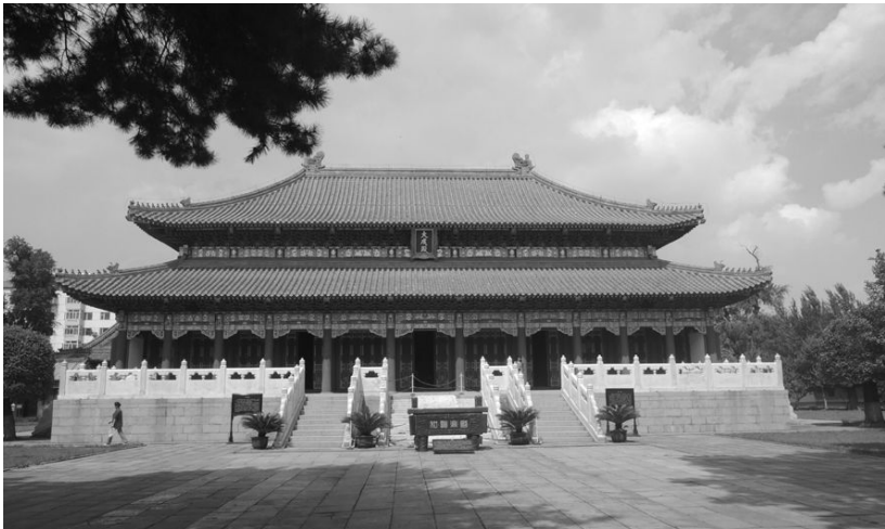
[사진 11] 대성전 전경

사실 이번 답사에서 가장 보고 싶었던 도시가 바로 이효석이 커피를 마셨다던 이 하얼빈이다. 하얼빈이라 하면 근대 동북아시아 문화의 꽃이라고 할 만큼 우리 근대 문학 작품에도 심심치 않게 등장하는 터라 ‘동방의 파리’, ‘동방의 모스크바’라는 별명에 걸맞은 모더니즘의 집성체를 상상하고 있었는데, 뜻밖에도 우리가 가장 먼저 향했던 곳은 바로 문묘였다.