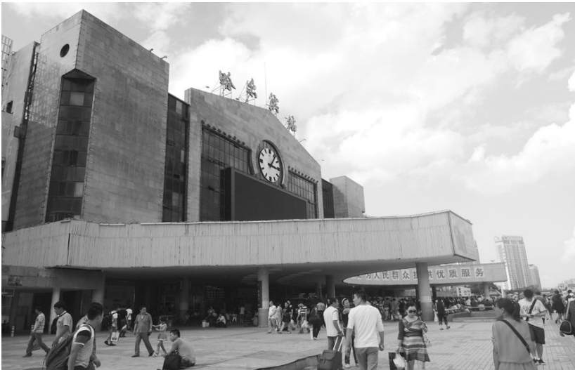
[사진 17] 낮에 본 하얼빈역 전경