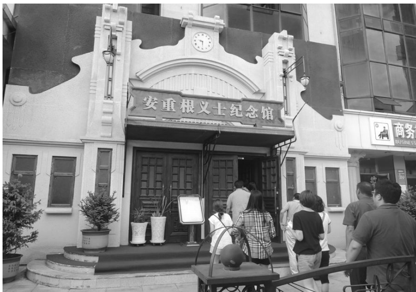
[사진 12] 안중근의사기념관 입구

하얼빈 문묘는 웬만한 궁전보다도 웅장하다는 느낌이 들 정도로 잘 손질 되어 있었는데, 그 중심인 대성전은 지붕의 황색 기와들마저도 반들반들하게 빛나 보였다. 공자를 향한 태도가 황제에 대한 태도보다도 조심스럽고 정성 어린 것처럼 느껴졌다. 이때쯤 되니 청색 현판과 붉은 벽, 노란 지붕이 어우러진 독특한 건축 양식이 눈에 익기 시작해서 더 친근한 느낌이 들었다. 대성전 안의 제단에는 산 제물 대신 동물의 모양을 본떠 만든 목각 인형이 놓여 있었다. 전원에 놓인 커다란 공자의 상 앞에서 나도 학문 성취의 염원을 담아 분향하였는데, 과연 영험이 있을지 없을지는 두고 보아야 알 것 같다.