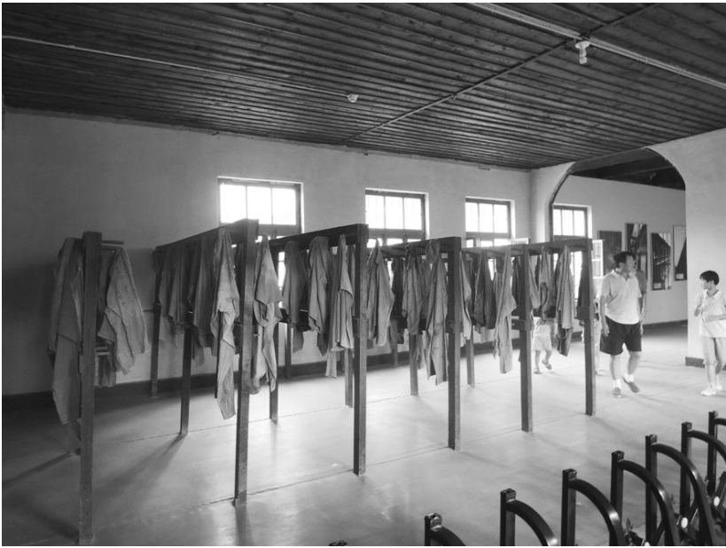
[사진 2] 휘순감옥 탈의실

감옥 건물 입구를 들어서자 가장 먼저 보인 것이 탈의실이었다. 수감자들이 사복을 벗고 죄수복으로 환복하는 곳으로 투박한 옷걸이와 옷을 복원하여 두었다. 휘순감옥은 안중근과 신채호, 이회영이 구금되었던 것으로도 유명하고, 감옥 안을 둘러보면 각종 고문 기구가 즐비하게 늘어선 고문실이나 교수형을 집행하던 사형실, 사형된 시체가 빠진 통을 통째로 들고나가 파묻은 무덤 등 죽음과 공포를 상기시키는 장소들을 많이 만날 수 있다. 안중근 의사가 생활했던 독방은 매우 공들여 복원되어 있고, 그 옆에는 커다랗게 안중근 의사의 수감에 관한 기록을 적은 금색 패널도 붙여 있어 사진을 찍으려는 사람들로 북적거렸다. 바닥이 덜컹 열리는 마룻바닥과 천장으로부터 늘어진 굵은 밧줄 올라기, 그리고 목을 맨 시체를 바로 떨어뜨려 넣을 수 있는 나무통이 바닥에 덩그렇게 놓인 사형실도 인상적이다. 그러나 이상하게도 나는 휘순감옥을 떠올리면 탈의실이 가장 먼저 생각난다. 앞으로 끌려