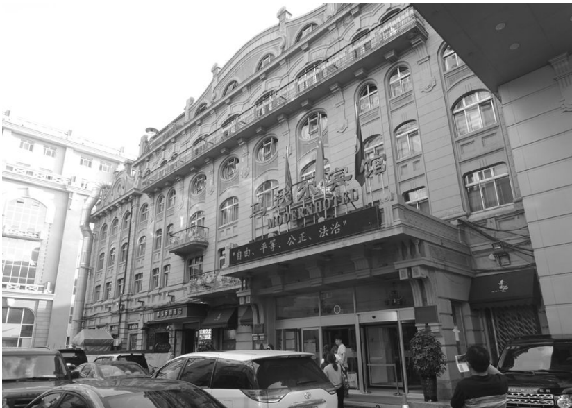
[사진 16] 모던호텔 입구

둘을 깔아 포장한 거리는 금방이라도 옛날처럼 마차가 따각따각 지나갈 것 같은 착각을 불러일으켰다. 분명 키타이스카야 거리도 러시아인들이 조성한 것이지만, 이곳은 성소피아 성당이 보여주는 경건하고 정돈된 분위기와는 달리 자유분방하고 쾌활한 분위기로 넘쳤다. 푸르게 늘어선 가로수 너머 거리 양옆으로 뻗은 건물들은 근대의 양식을 매우 잘 보여주고 있었다.