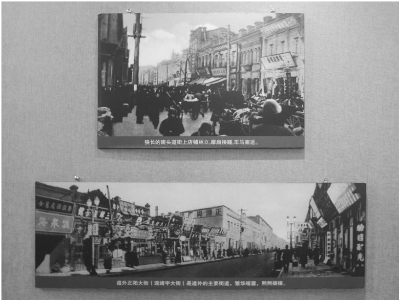
[사진 14] 성소피아 성당 내부에 전시된 당시 하얼빈 거리 사진

월에 시작한 재건축을 9년간 지속하여 완성된 건물로, 적벽돌로 쌓은 몸체와 푸른 지붕, 금색 십자가로 이루어진 건물이 가을하늘처럼 짙하게 갠 푸른 하늘을 배경으로 서 있었다. 마치 영화처럼 교회당 종이 치고 비둘기 떼가 양파 모양의 지붕을 휘감고 나는 것이 하얼빈의 다른 풍광과 대비되어 이색적인 아름다움을 보여주었다. 교회당 내부에는 예전 하얼빈의 모습을 촬영한 사진과 그림 자료들이 전시되어 있어 시간 가는 줄 모르고 구경했다.