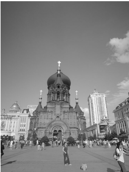
[사진 13] 성소피아성당 전경

현지인들에게 잘 알려져 있다는 식당에서 맛있게 식사를 마친 후, 우리가 다시 향한 곳은 안중근의사기념관이었다. 주택가 한 칸에 있어 조용하고 널찍했던 문묘와 달리 안중근의사기념관은 혼잡한 하얼빈역 대로 바로 옆에 있었다. 문묘에서 느꼈던 차분한 분위기는 순식간에 사라지고, 역동적인 인파가 압도적인 인상을 주는 곳이었다. 이토 히로부미를 저격했던 하얼빈역 바로 옆에 위치한 기념관에는 안중근 의사가 11일간 하얼빈에 머물며 거사를 기획하고 달성한 과정이 기록되어 있었고, 동상과 유필을 비롯한 각종 자료들이 전시되어 있었다. 크기나 규모가 크다고 할 수는 없는 곳이었으나 그 위치가 워낙 시사적인 터라 실감되는 바가 컸다. 안중근의사기념관 앞을 오가는 수많은 인파는 과연 이곳이 어떤 곳인지, 이곳에서 기념하는 것이 무엇인지를 알고 있을까? 이곳은 하얼빈시와 철도국이 공동으로 건립비용을 부담하여 개관했다고 하니, 항일(抗日)의 기치 아래 연대했던 근대 동아시아의 정치적 숙명을 느낄 수 있었던 장소이기도 했다.