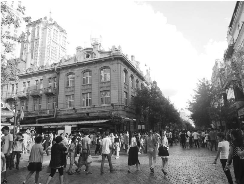
[사진 15] 키타이스카야 거리 전경

너른 대로를 따라 햇빛을 받으며 걸어가 당도한 곳은 자오린공원이다. 자오린공원은 원래 하얼빈에 건립된 최초의 공원으로 하얼빈공원이라 하였는데, 중국의 항일영웅인 리자오린(李兆麟) 장군의 유해를 안장한 것을 계기로 1946년부터 자오린공원이라 개명했다고 한다. 특히 이곳은 안중근 의사가 이토 히로부미를 저격하기 직전에 거닐었던 곳으로, “내가 죽거든 시신을 하얼빈공원에 묻었다가 조국이 독립되거든 고국으로 옮겨 달라”는 유언을 남겼다는 일설도 있다. 노란 기둥 사이의 문을 지나자 나오는 푸른 공원 안에는 나들이 나온 인파가 가득 들어차 있었다.