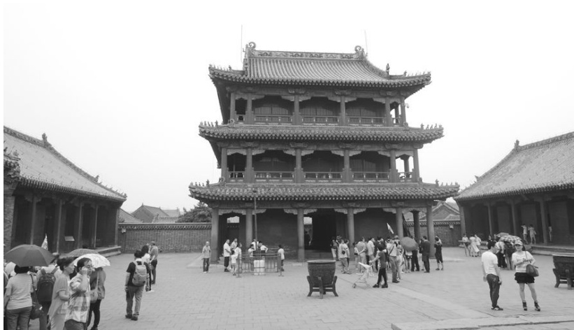
[사진 7] 봉황누각을 뒤에서 바라본 경관

유일한 남자였던 서재길 선생님은 고개를 절레절레 저으셨지만, 나는 냥냥이 된 듯한 기분에 머리띠를 벗지 않았다. 중원으로 가는 길에 마주친 어느 중국인 할아버지가 이런 나의 모습을 보고 웃으시며 중국어로 뭐라 말씀 하셨는데, 분명 한숨 같은 것이 중간에 섞이긴 했지만 예쁘다는 말이었을 것이라고 믿는다. 하지만 중원에 이르니 사람들이 너무 많아서 엄치없는 나 도 머리띠를 벗어둘 수밖에 없었다.