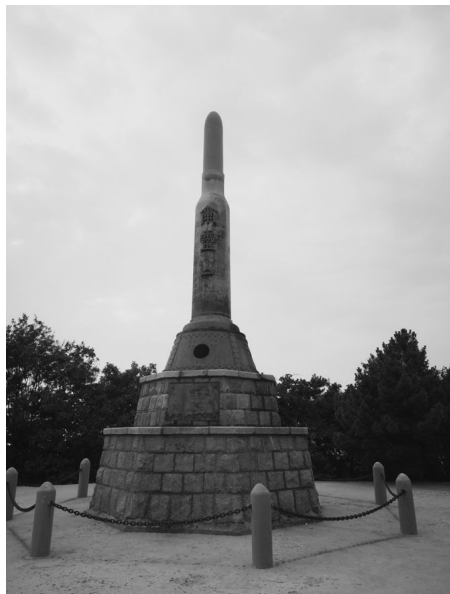
[사진 4] 얼링산 위령비

고지의 정중앙에는 탄환 모양의 거대한 비(碑)가 돌로 쌓은 축대 위에 서 있었다. 이 비는 러일전쟁 당시 일본군과 러시아군이 사용했던 탄환과 무기를 모아서 녹여 만든 것이라 한다. 중국어로 203을 음차하여 ‘얼링산’이라 부른다는 설이 있고, 한편 당시 전투를 지휘했던 일본 육군대장 노기 마레스