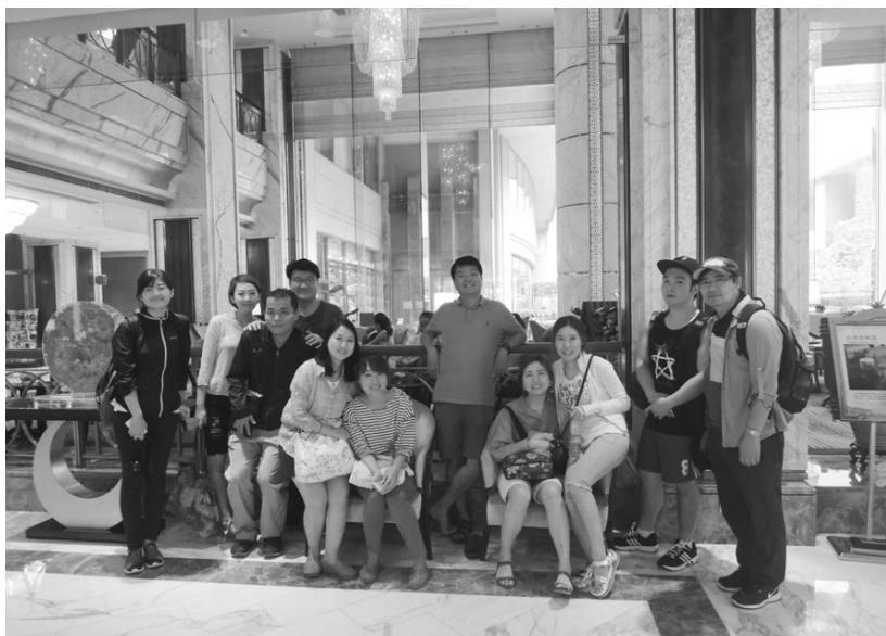
[사진 18] 상그릴라 호텔에서 조식을 먹은 후 기쁨에 차서

하지만 전화위복이라 했던가. 야간열차를 타고 하룻밤 만에 꼬질꼬질해진 막내들이 너무 안 돼 보였는지 선생님들이 결단(!)을 내리셔서 우리는 상그릴라 호텔에 조식을 먹으러 갈 수 있었다. 일천한 호텔 조식 경험 속에서도 이 상그릴라 호텔의 조식은 단연 탑이라 할 만 했다.