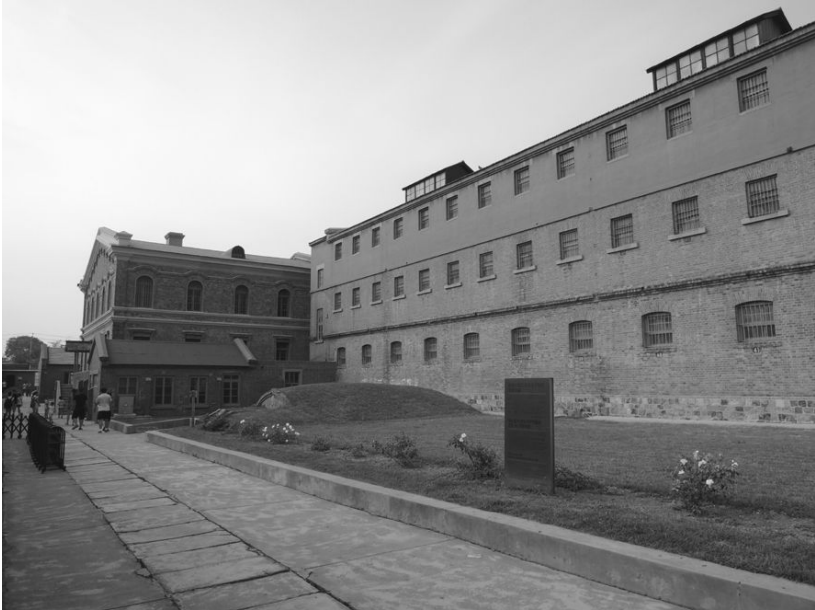
[사진 1] 휘순일야감옥구지 전경

구지박물관에 도착했을 때에도 날씨가 약간 흐려서, 적벽돌로 쌓은 3~4층 높이의 거대한 감옥이 더욱 을씨년스럽게 보였다. 철조망을 둘러친 높은 담과 감시소가 더욱 위압적으로 보이는 곳이었다.