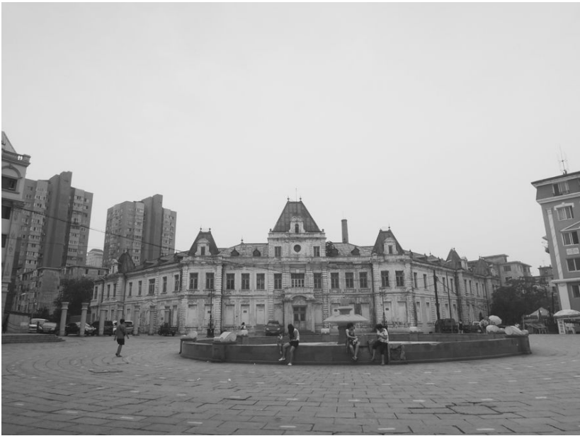
[사진 22] 구 동청철도 다렌사무소 전경

이곳은 다렌 건설 당시 도시 건축을 책임졌던 사하로프가 건설한 거리로, 백여 년 전 지어졌던 당시의 건물들이 거의 원형 그대로 남아있었다. 이 거리의 초입에는 현재는 미술관으로 사용되는 뽀족 지붕의 적벽돌 석조 건물이 서 있다. 흰 화강암과 적벽돌을 섞어 쌓은 벽면과 검은 지붕의 이 건물에서는 금방이라도 러시아 군인들이 나올 법한 이국적인 풍정이 있었다. 미술관을 필두로 하여 양옆으로 고색창연한 건물들을 거느리고 쪽 뺨은 길의 끝 쪽에는 물이 다 말라버린 낮은 분수 뒤로 거대한 규모의 흰 석조 건물이 앉아 있었다. 지붕의 녹색이 원래 색깔인지 아니면 세월에 닳아 풍화된 것인지 분간이 안 될 정도로 손질이 안 된 상태였지만, 군데군데 거무스름하게 변색된 외양에도 불구하고 규모만큼은 웅장하였다. 이 건물은 애초에 동청철도 다렌사무소로 건설되었다가 다렌시청사, 요동수비군사령부, 관동성 민정서, 관동도독부민생부, 만철 본사, 다렌 야마토호텔 분관, 다렌의원, 만