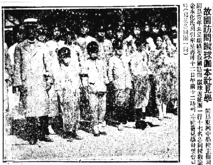
[그림 3] 동흥중학의 고국방문 축구단(출전: 1926.06.14., 『동아일보』)

이 대회와 1924년 중학부 대회에서는 폭행·상해 사건이 발생했다. 동흥(東興) 중학과 은진(恩眞) 중학의 시합 도중 심판의 판결이 불공평하다며 동흥 중학의 선수가 심판을 때려 중상을 입히는 사건이 일어난 것이다. 33) 이 폭행사건은 큰 문제가 되었고, 동흥중학에게는 5년간 대회참가를 금지하는 등 엄한 조치가 내려졌다. 사료에서는 사건 후 경위를 확인할 수 없지만, 간도 대회에 참가할 수 없게 된 동흥중학은 1926년 5월부터 고국방문 축구단이라는 것을 조직하여 조선으로 축구원정을 가게 되었다는 것을 확인할 수 있다. 이 원정은 “1. 평양 2. 안주 3. 정주 4. 선천 5. 철산 6. 신의주 및 안동현 7. 경성 8. 원산 9. 함흥 10. 북청 11. 성진” 34) 순으로 이동했고, 원정 기간이 한 달이나 되는 일정이었다.