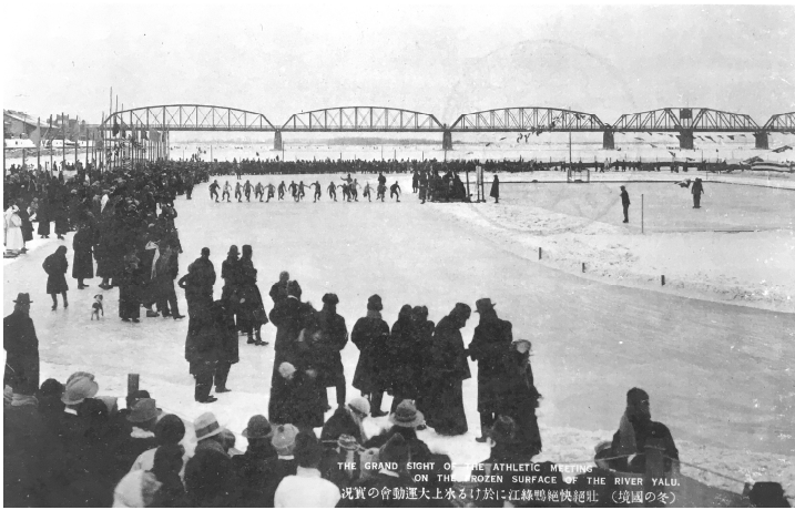
[그림 4] 압록강에서 열린 스케이트대회의 모습

안동에서는 겨울 스포츠도 주목을 받았다. 겨울이면 안동과 신의주 사이를 흐르는 압록강이 얼어붙어 천연 스케이트 링크장이 만들어졌고, 20세기 초부터는 얼어붙은 겨울의 압록강 위에서 스케이트를 즐기게 된 것이다. 압록강에 스케이트가 처음 등장한 것은 러일전쟁 후인 1906년의 일이며, 56) 이후 결빙기의 스케이트는 안동과 신의주의 시민들에게 겨울의 풍물로 자리잡았다.